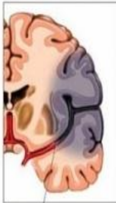
Сгусток перекрывает ток крови в части мозга