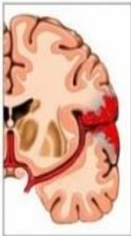
Кровотечение в ткани головного мозга