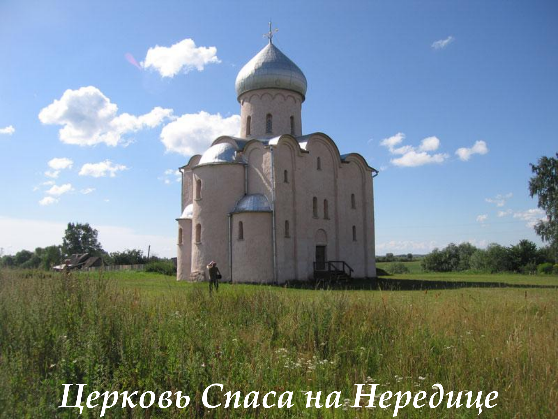
Церковь Спаса на Нередице