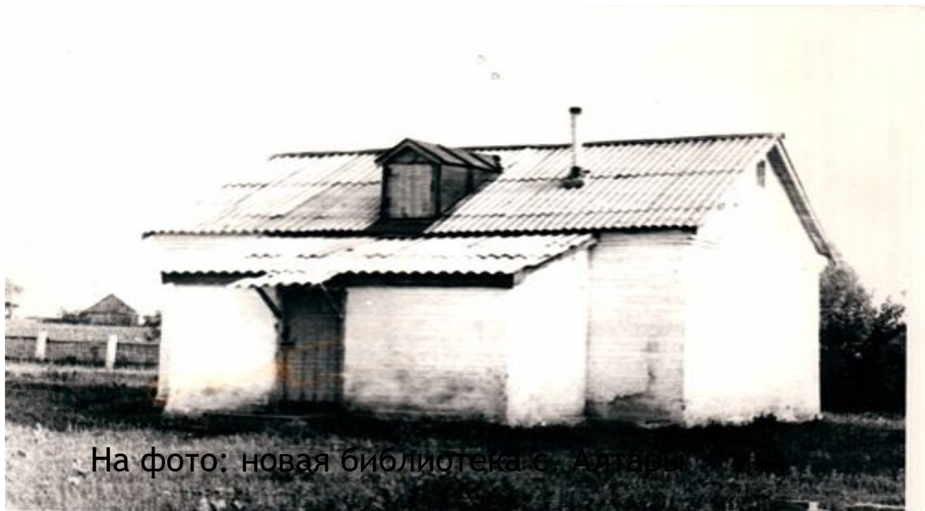
На фото: новая библиотека с. Алтары