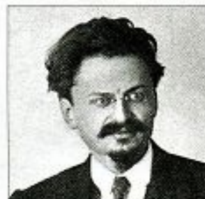
Троцкий (Бронштейн) Лев Давидович (1879–1940)