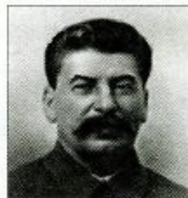
Сталин (Джугашвили) Иосиф Виссарионович (1879–1953)