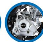
СИСТЕМА EXHAUST T.E.C