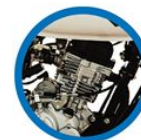
СПОРТИВНАЯ КОРобКА ПЕРЕДАЧ