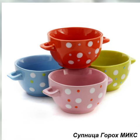
Супница Горох МИКС