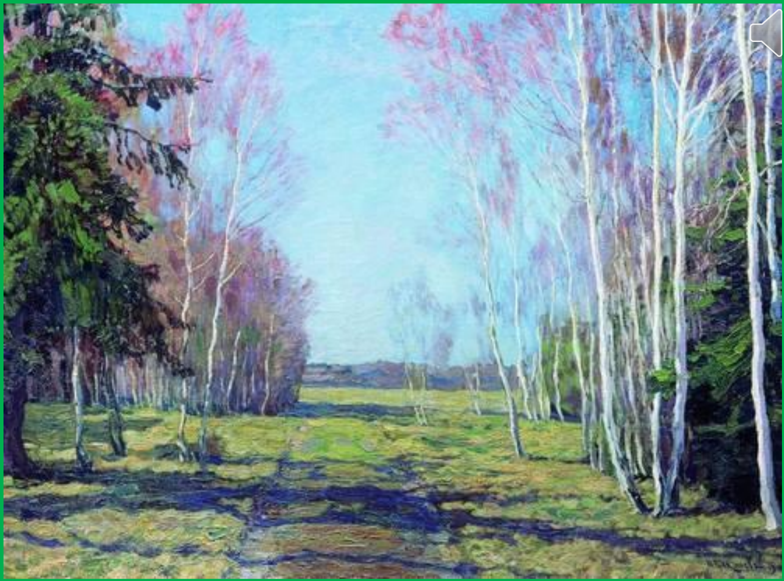
В.Н. Бакшеев В начале весны.