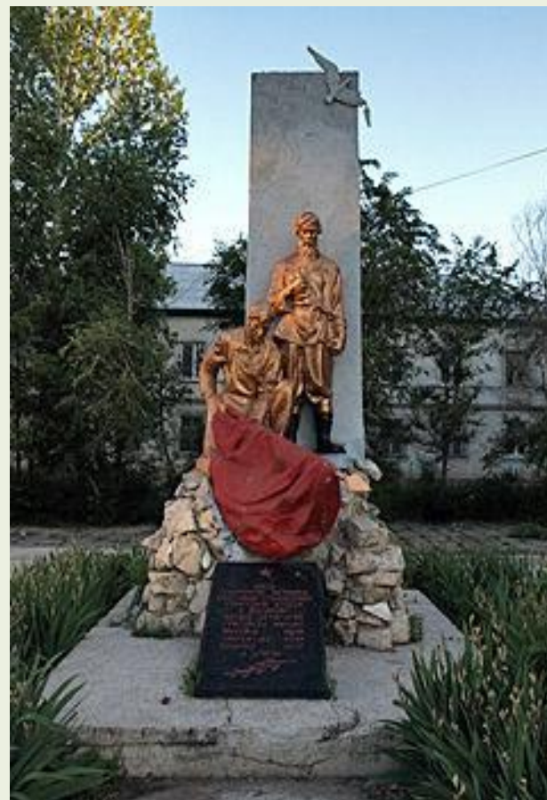
Памятник борцам революции