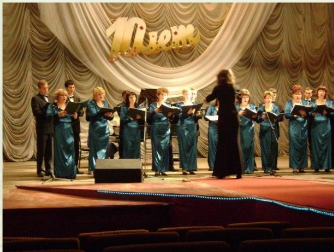
Камерный хор "Откровение"