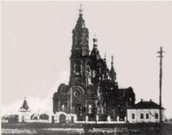
Старая Троицкая церковь

Во второй половине XVIII века в Балакове были построены три церкви, само село было государственным.