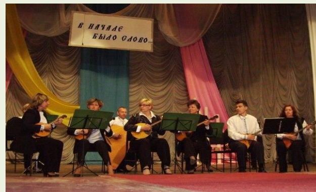
Ансамбль народных инструментов "Наигрыш"