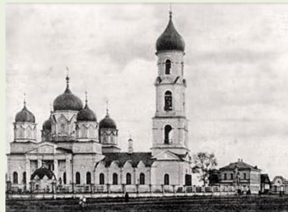
Храм Иоанна Богослова