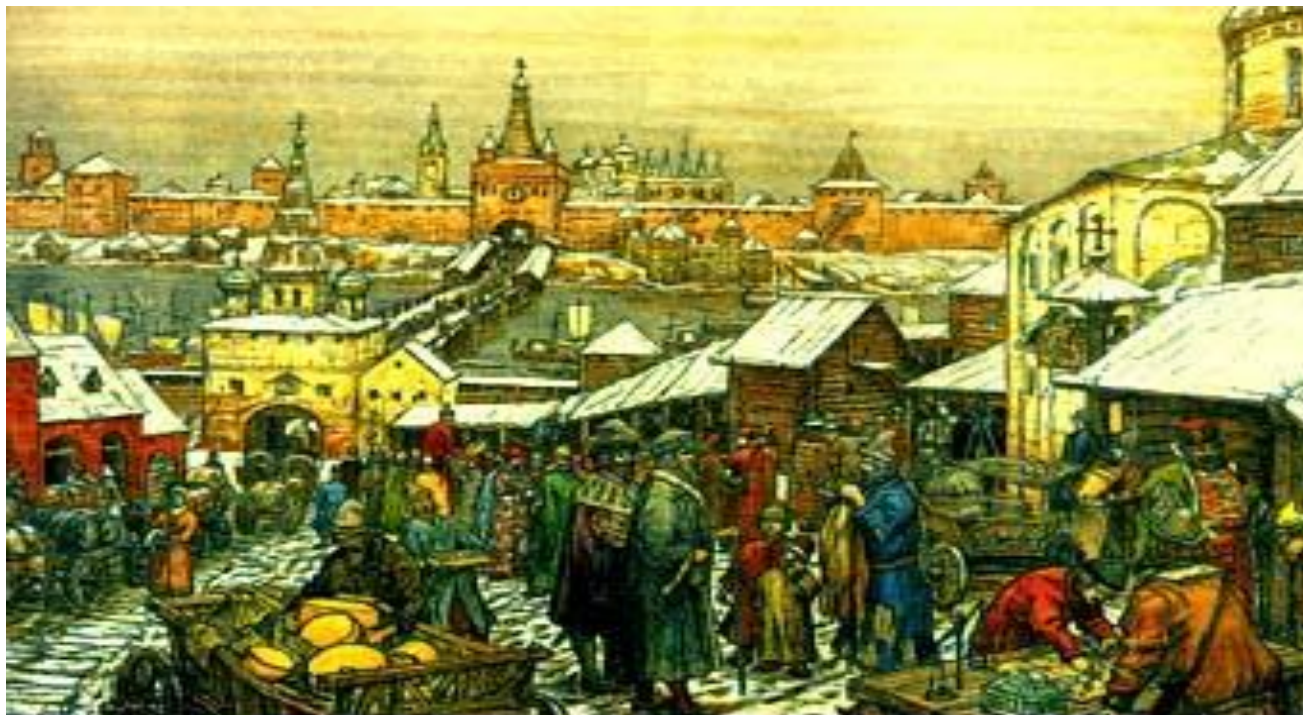
А.М. Васнецов "Новгородский торг"