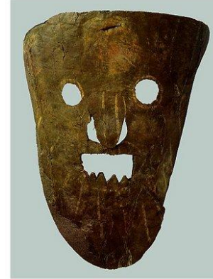
Маска скomorоха. Украшена цветной росписью. Кожа. Размер 25,5 × 23 см. Начало XIII в.

6. В новгородской республике существовала выборная должность: