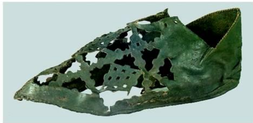
Туфля с прорезным ажурным орнаментом. Кожа. Длина 27 см. XIV в.