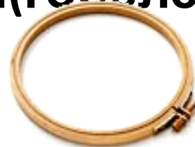
деревянные пяльцы с металлическим винтом