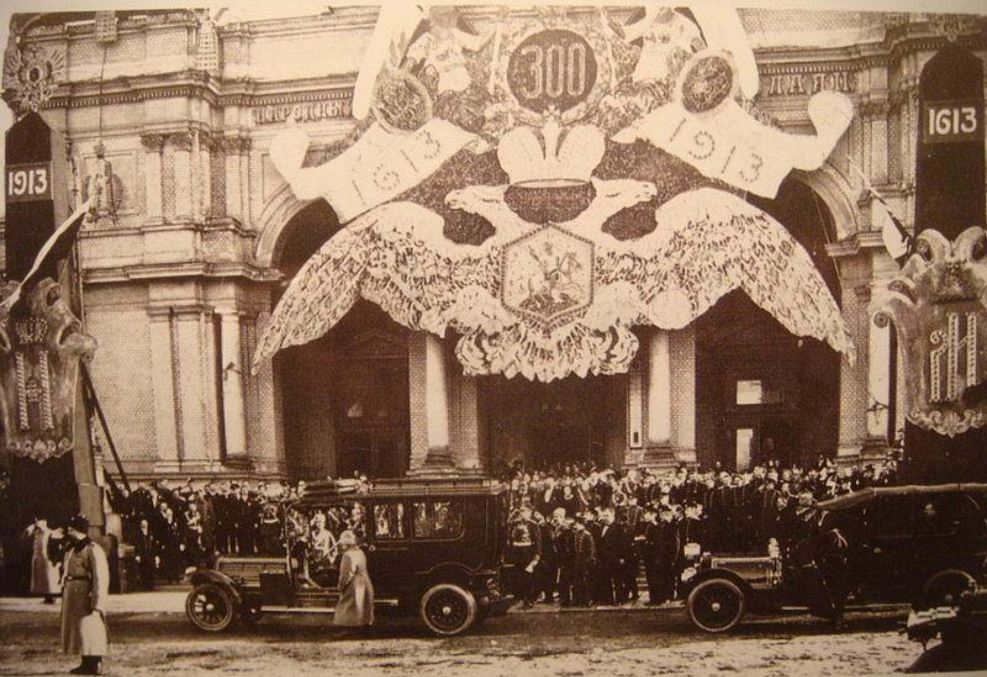
During the 300th-anniversary celebrations Nicholas II dedicates "The house of the People" which he has found