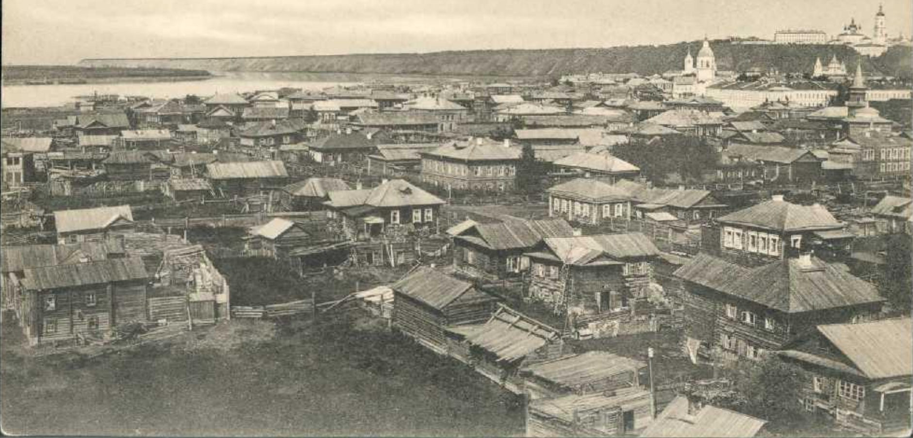
Тобольскъ, Общій видъ города