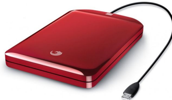
внешний жесткий диск