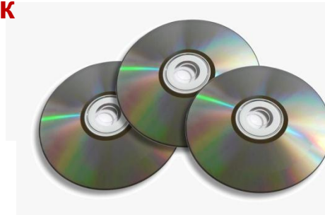
CD / DVD диски