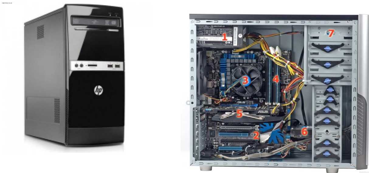
Стационарный, настольный компьютер

Основная часть компьютера - системный блок . В нем располагаются устройства, считающиеся внутренними . К ним относятся процессор, жесткий диск, оперативная память и др.