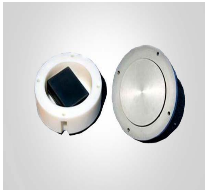
Автономный поисковый ГЛОНАСС/GPS терминал