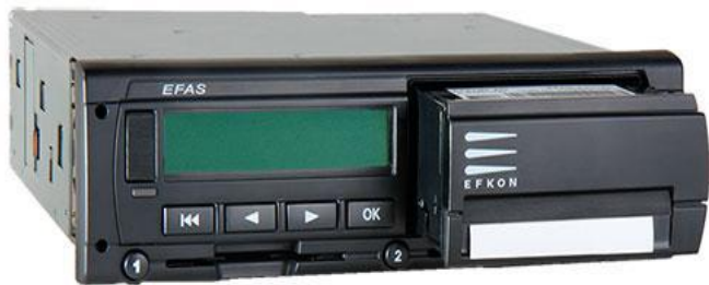
Тахограф EFAS V2 RUS