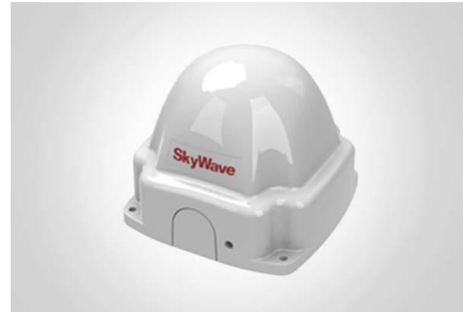
Спутниковый терминал SKYWAVE IDP-690