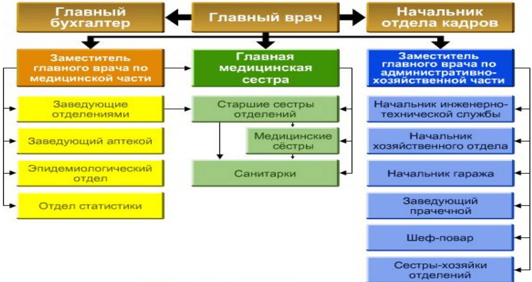
Типовая схема организации работы в ЛПУ

В зависимости от типа ЛПУ организация работы имеет те или иные особенности.