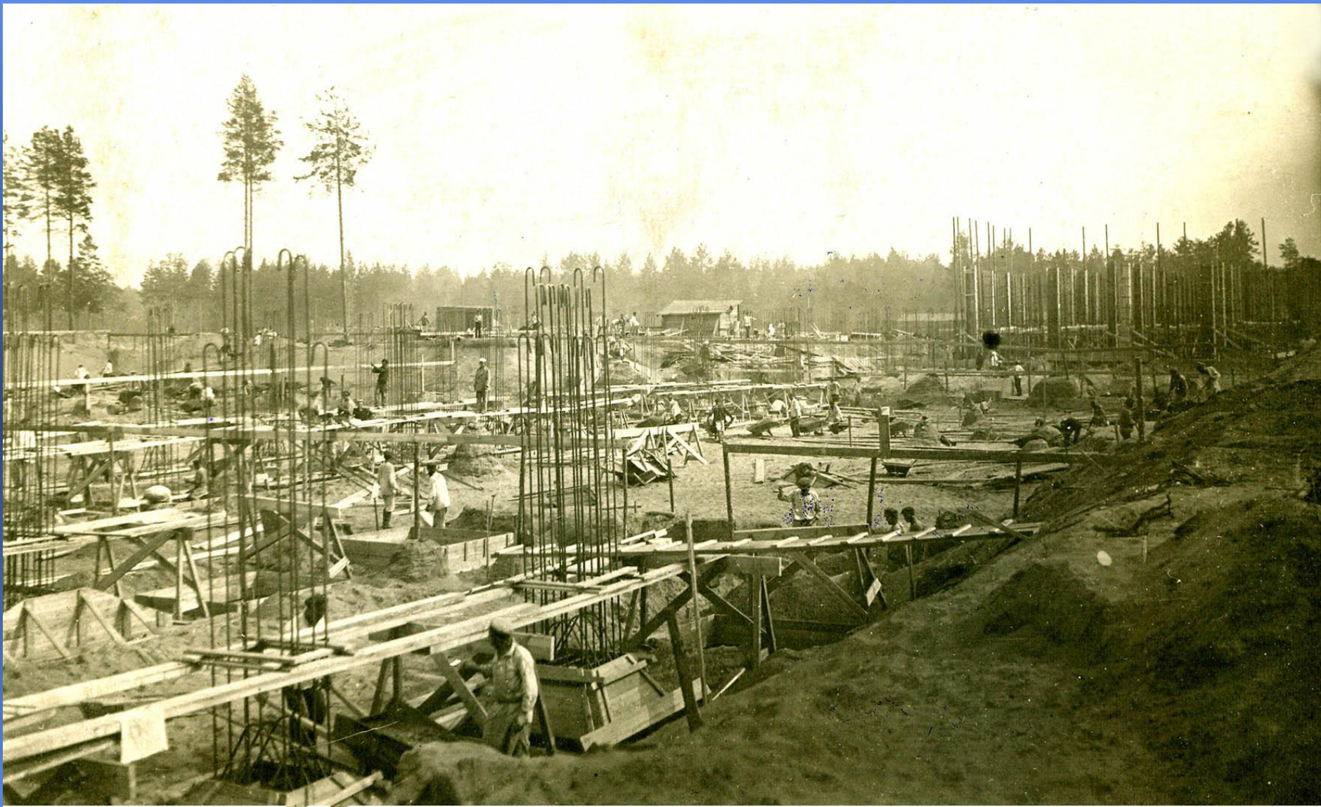
Бетонирование подушки фундамента главного здания. 1927г.