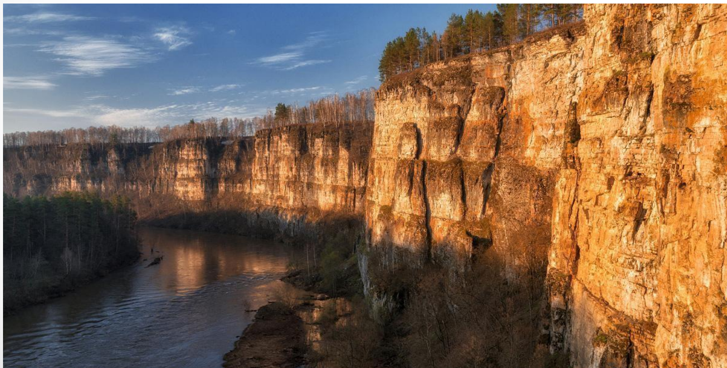
Национальный парк Зюраткуль