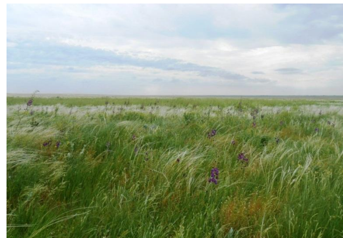
Государственный природный заповедник Ростовский