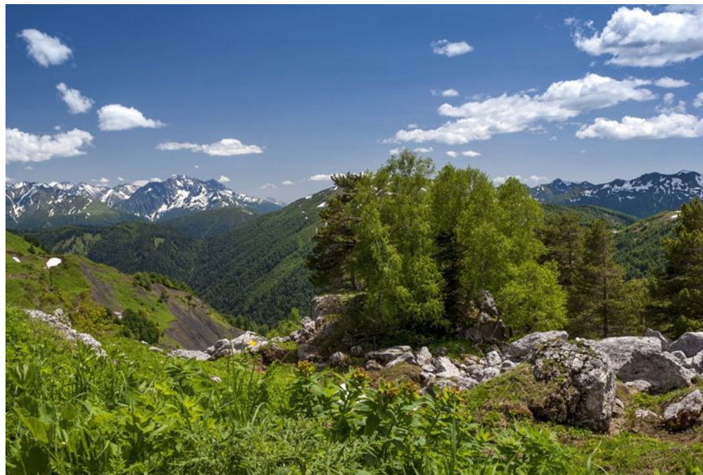
Кавказский Государственный биосферный заповедник

Статус государственных природных биосферных заповедников имеют государственные природные заповедники, которые входят в международную систему соответствующих резерватов, осуществляющих глобальный экологический мониторинг.