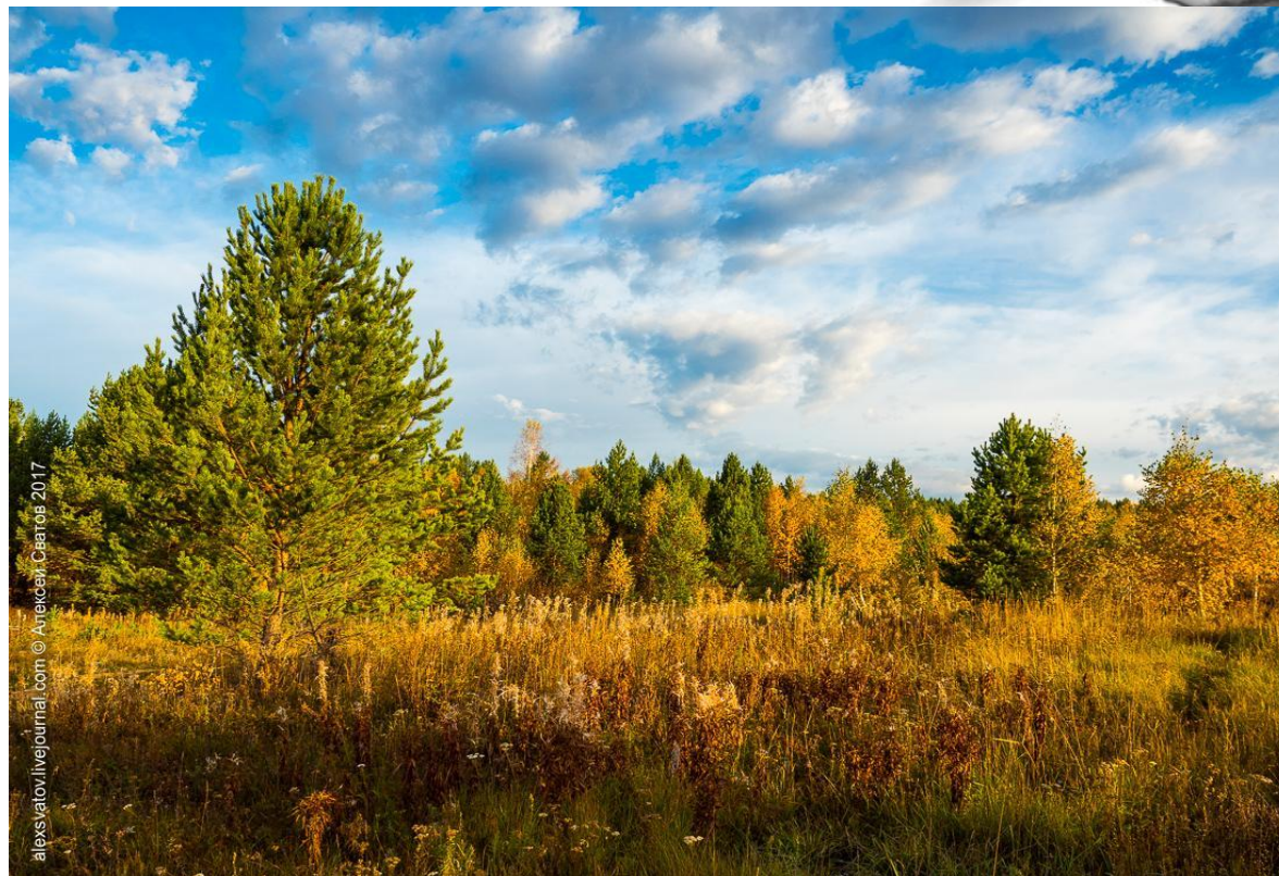
Заказник Красный Яр

Государственными природными заказниками являются территории, имеющие особое значение для сохранения либо восстановления природных комплексов или их компонентов и поддержания экологического баланса.