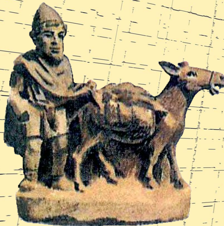
Крестьянин с осликом