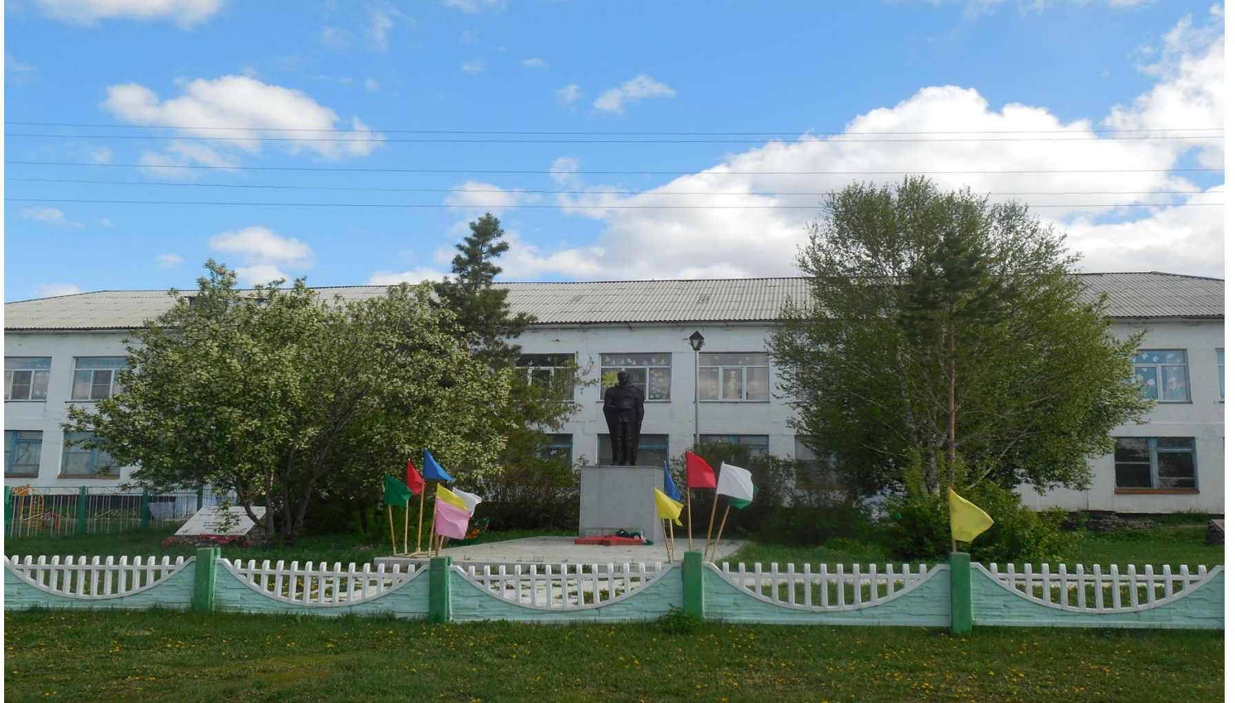
МКОУ «Маюровская СОШ» Новосибирской области, Сузунского района