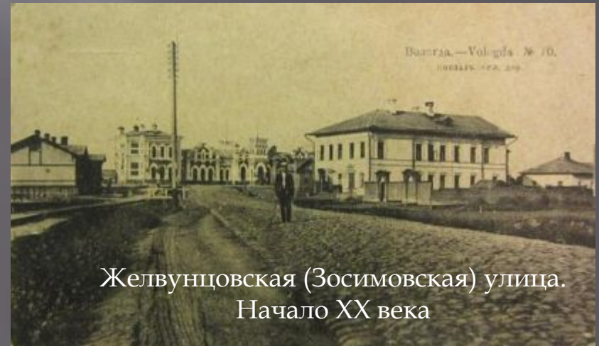
Желвунцовская (Зосимовская) улица. Начало XX века