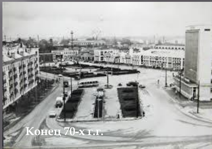
Конец 70-х г.г.