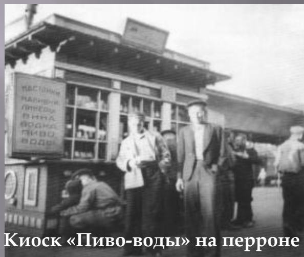
Киоск «Пиво-воды» на перроне железнодорожного вокзала ст. Вологда. Начало 50-х г.г.