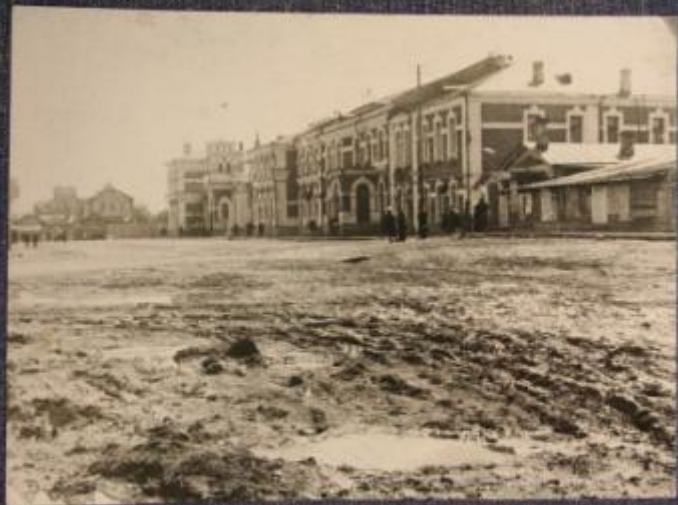
Привокзальная площадь до перемещения