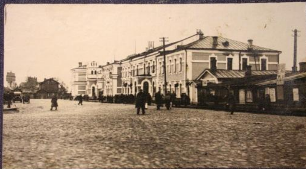
Привокзальная площадь в 1941 г.