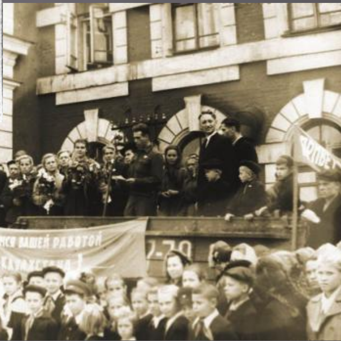
Газета «Красный Север». 28 сентября 1958 г.

ВОЛОГДСКИЙ ОТРЯД ЗАВОЕВАЛ В СОЦИАЛИСТИЧЕСКОМ СОРЕВНОВАНИИ КРАСНЫЕ ЗНАМЕНА ТЕРЕХТИН-