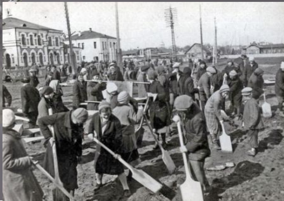
Субботник молодежи по разбивке сквера на пл. Шмидта в гор. Вологде в 1930 году.