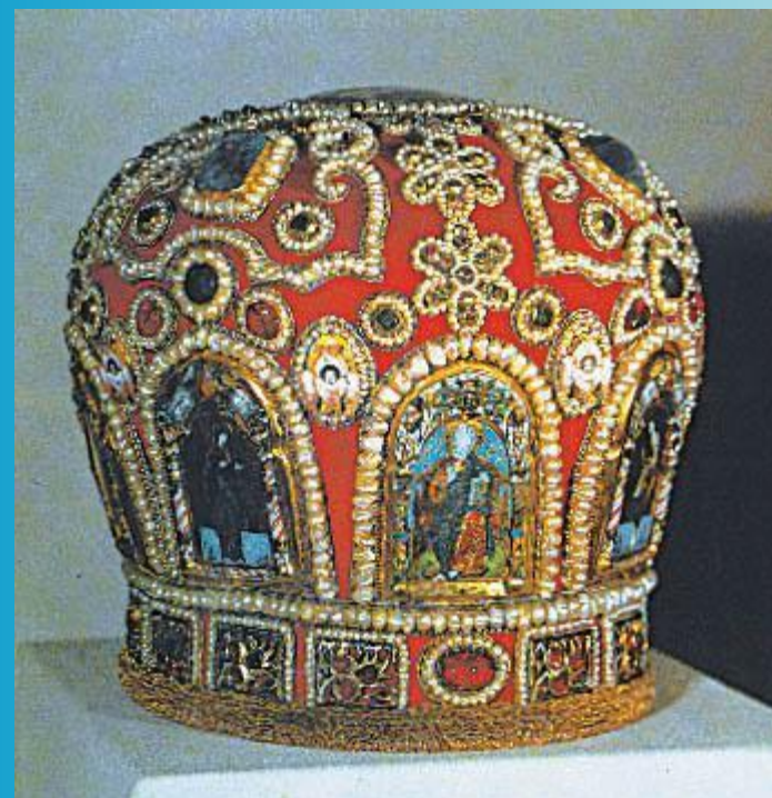
Патриаршая митра. XVI век

Главным достижением периода опекуинства Бориса стало возвышение в 1589 Московской митрополии до статуса патриархата, что сделало Русскую церковь независимой от Греческой и укрепляло ее международное положение.