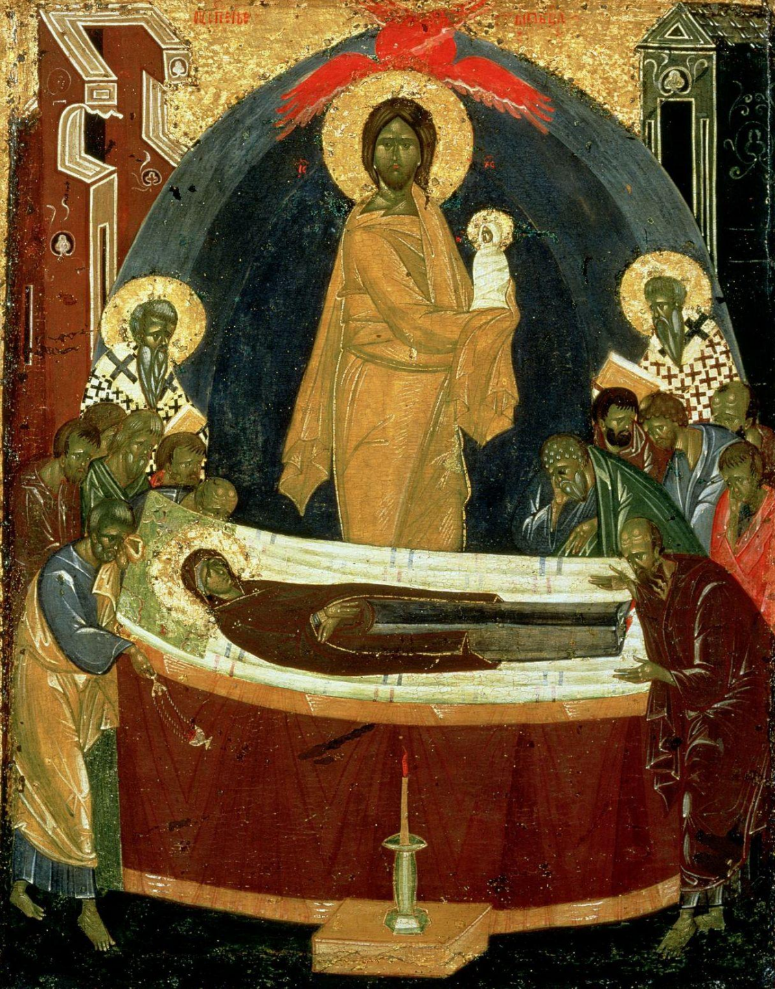
Успение Богородицы — 15 (28) августа