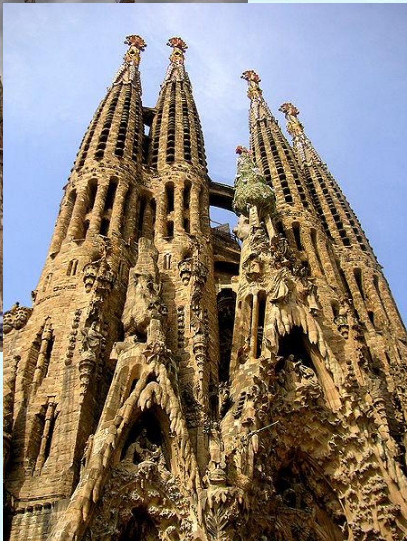
Храм Святого Семейства, Антонио Гауди, Барселона