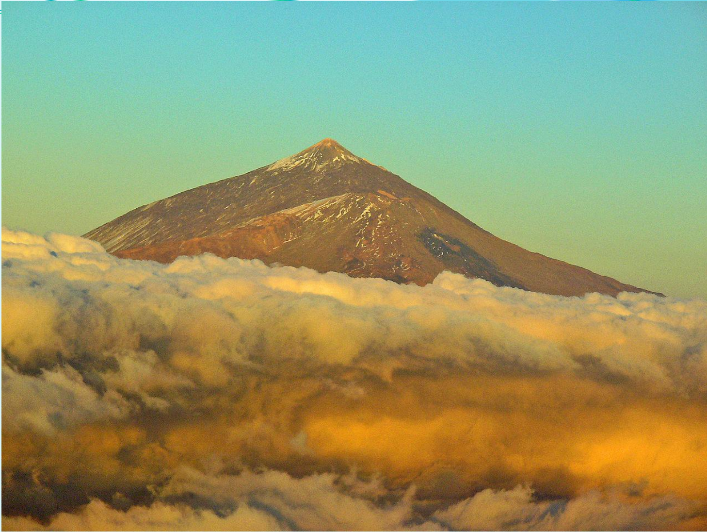
Тейде, вулкан на острове Тенерифе, самая высокая точка Испании.