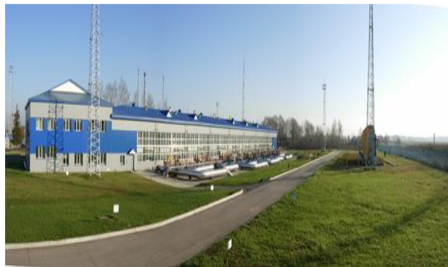
ООО «Газпром трансгаз Москва» филиал Гавриловское ЛПУМГ