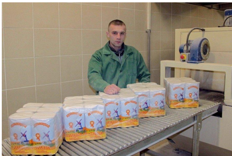
ОАО «Луховицкий мукомольный завод»