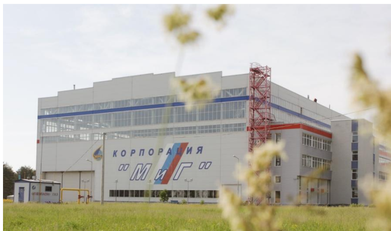
ПК № 1 АО «РСК «МИГ»