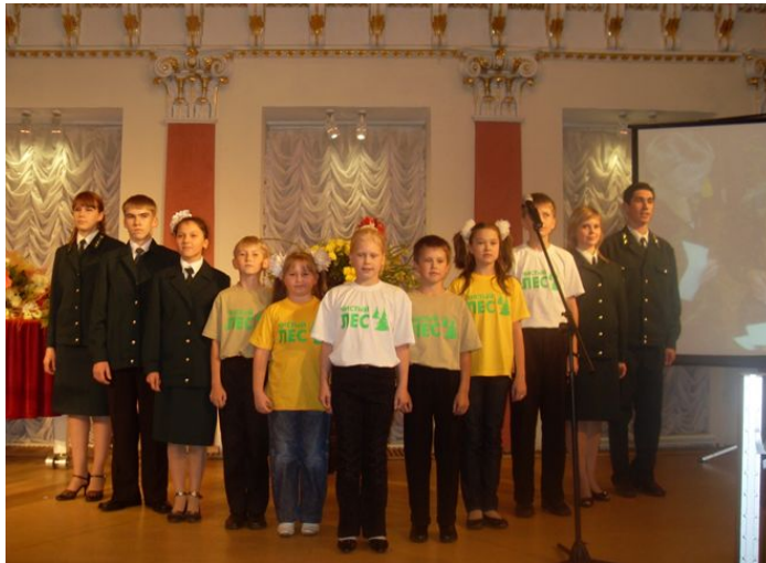
Школьное лесничество «Кедр»