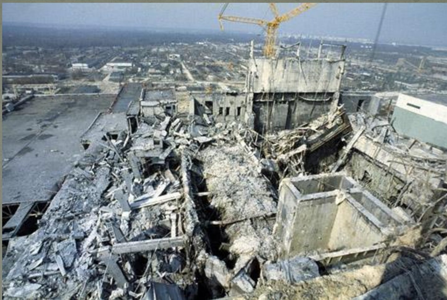
Обломки четвертого реактора.