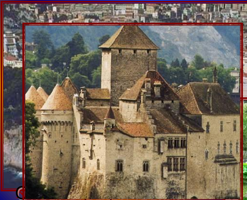
Музей Крепость Форт Антуан