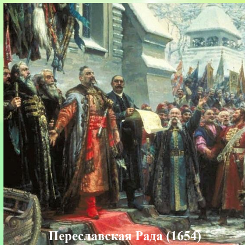
Переславская Рада (1654)

В 1654 г. началась война России с Речью Посполитой