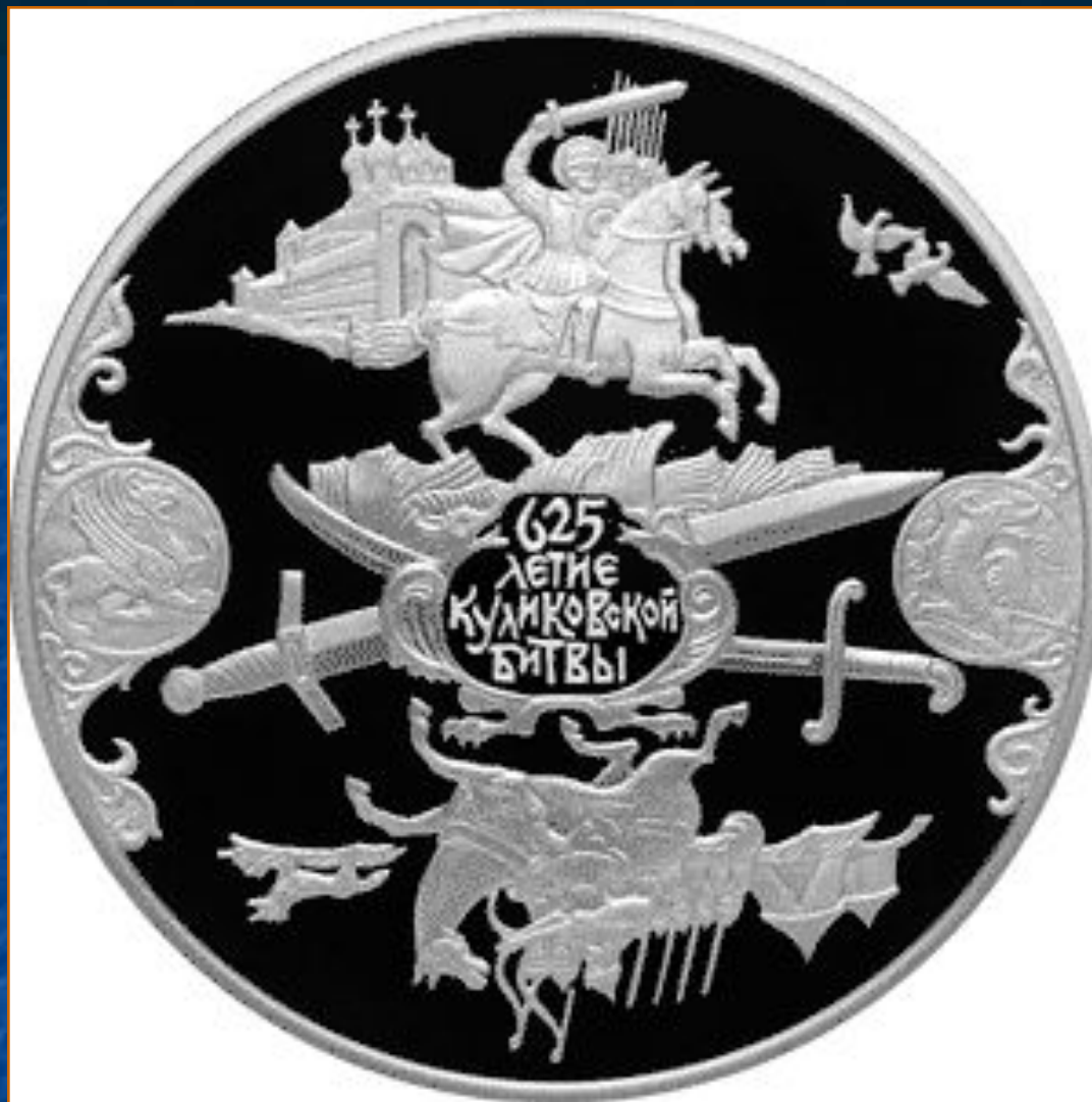
Медаль , выпущенная к 625-летию Куликовской битвы.