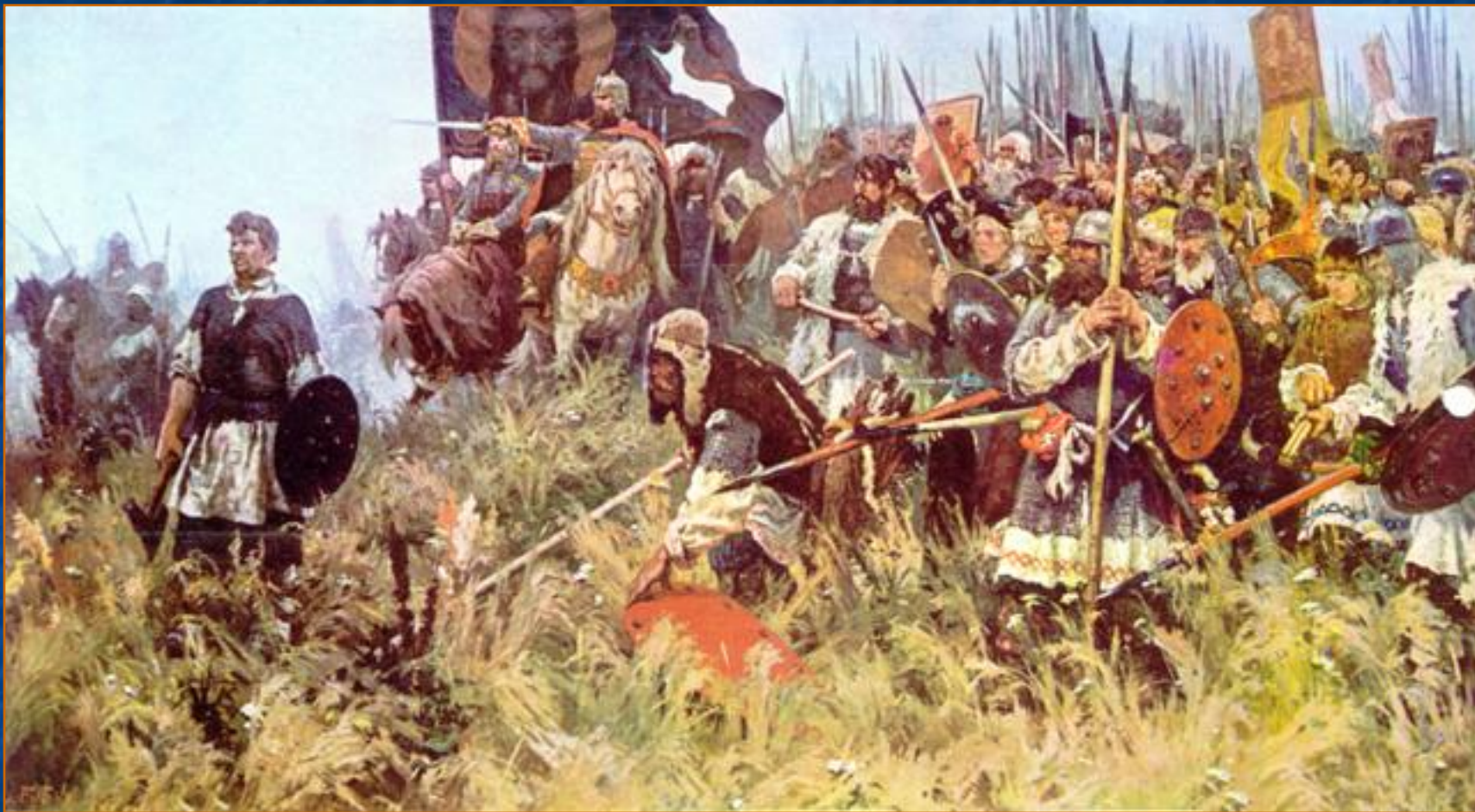
А. Бубнов «Утро на Куликовом поле».