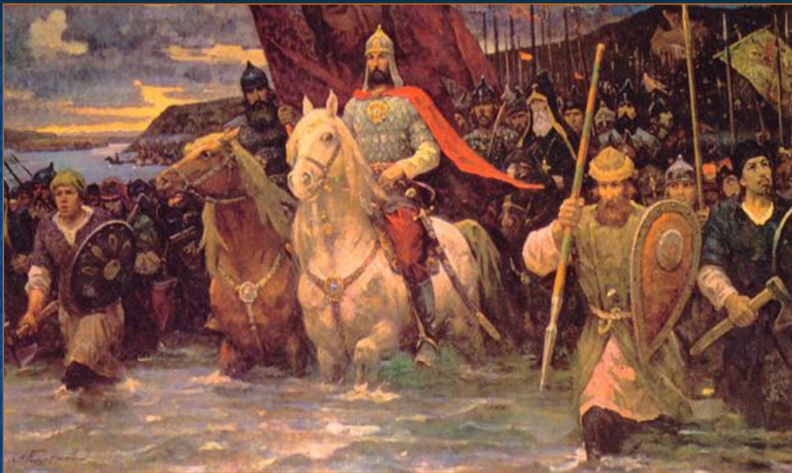
Данилевский «К полю Куликову».