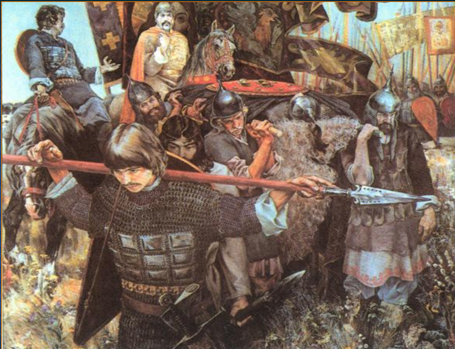
С. Присекин «С победой»