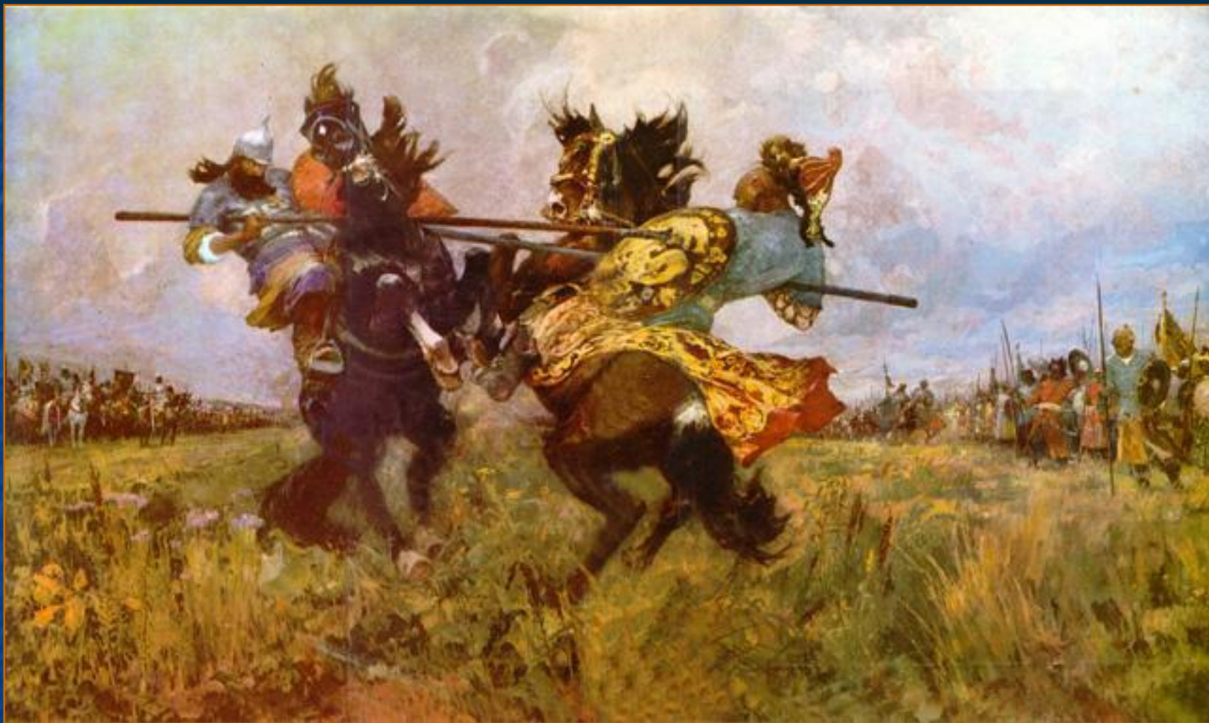
Авилов «Поединок Пересвета с Челубеем».