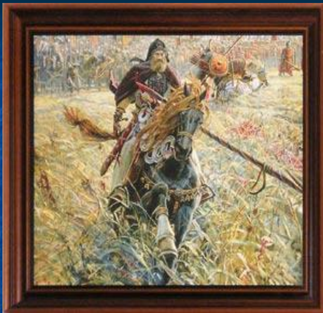
Пересвет перед поединком.