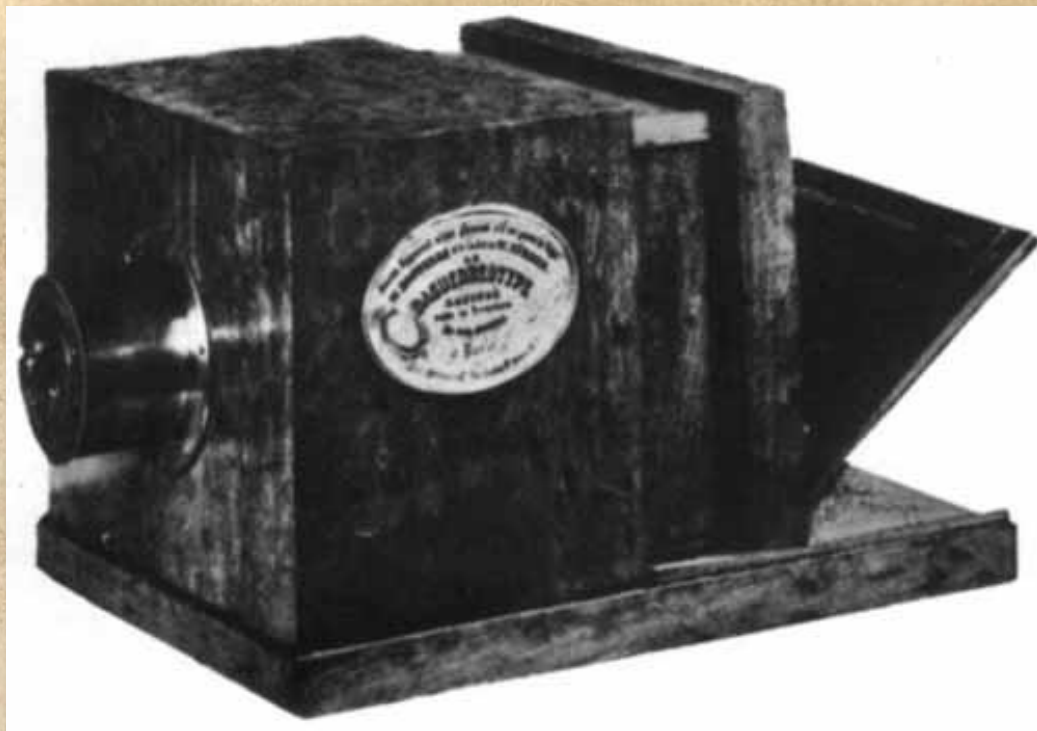
Рис. 7 - Оригинальная камера Дагера, сделанная Альфонсом Жиру, ее размеры - 12x14,5x20 дюймов. Надпись на бирке "Аппарат не имеет гарантии, если на нем нет подписи г-на Дагера и печати г-на Жиру. Дагеротип, сделанный Альфонсом Жиру под руководством изобретателя в Париже по улице Кок Сент-Оноре, 7"