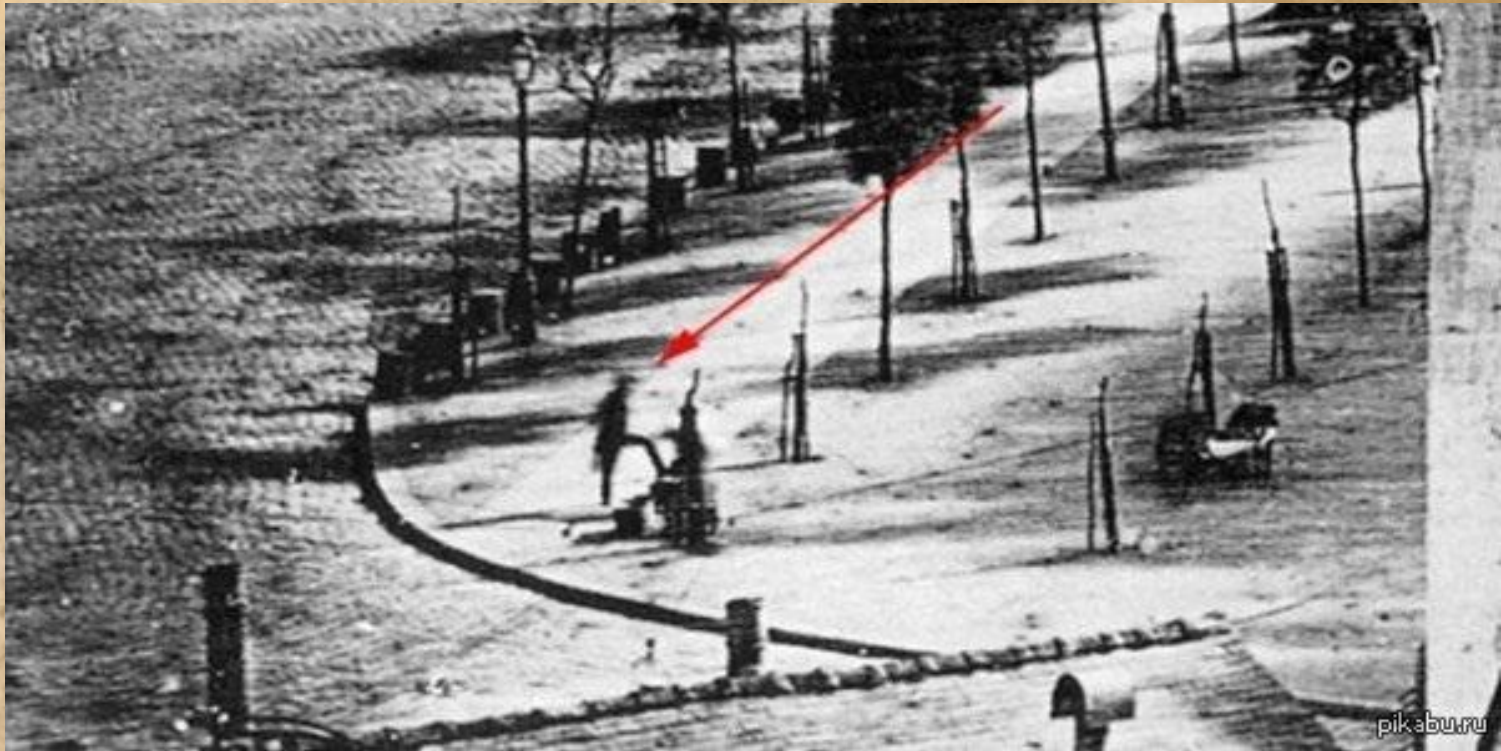
Рис. 4 - Эта фотография Луи Даггерра одной из улиц Парижа была сделана в 1838 году. При ближайшем рассмотрении в нижнем левом углу снимка можно отыскать фигуру мужчины, которому чистят обувь. Это, вероятно, первая в мире фотография с человеком, случайно попавшем в кадр.