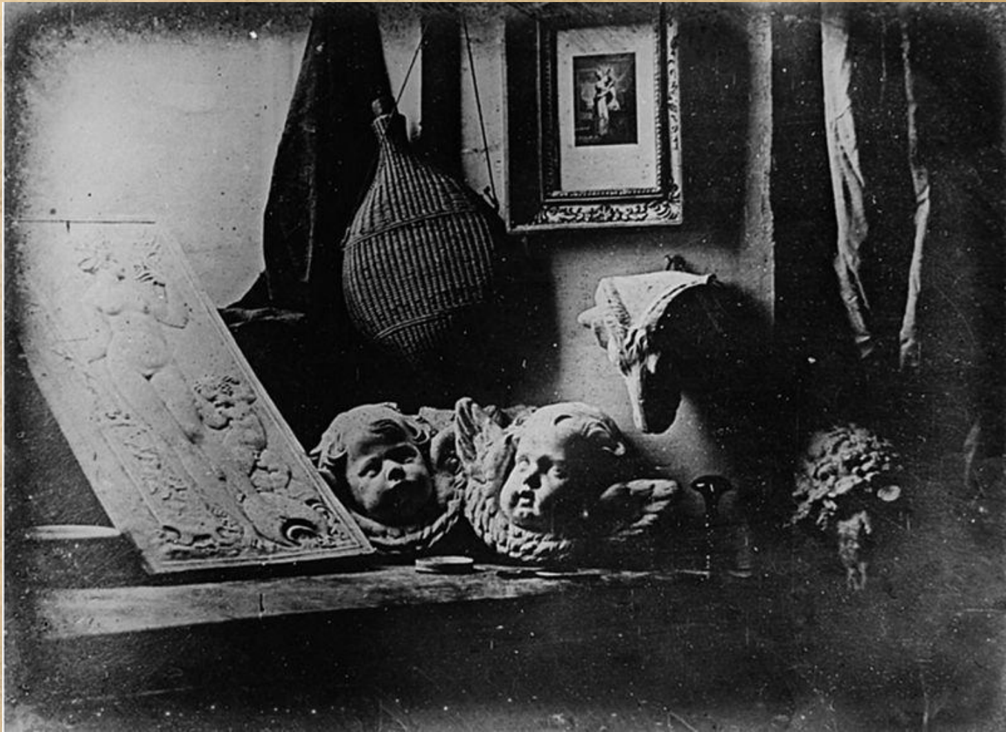
Рис. 6 - «Мастерская художника». Дагерротип (1837)