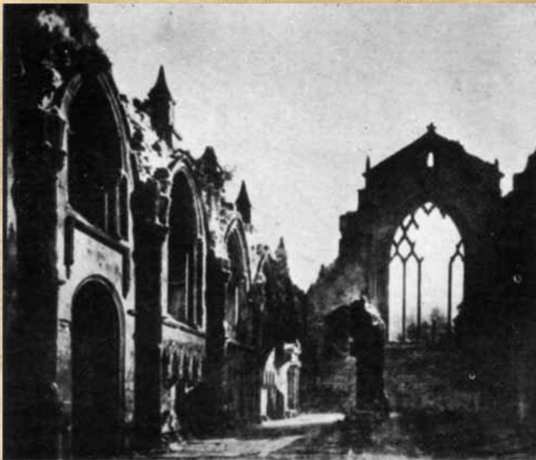
Рис. 5 - Церковь в Холируде, Эдинбург. 1824 год. Масло. Эта картина считалась лучшей из станковых картин Дагера; она была награждена орденом Почетного Легиона, когда была показана на выставке.