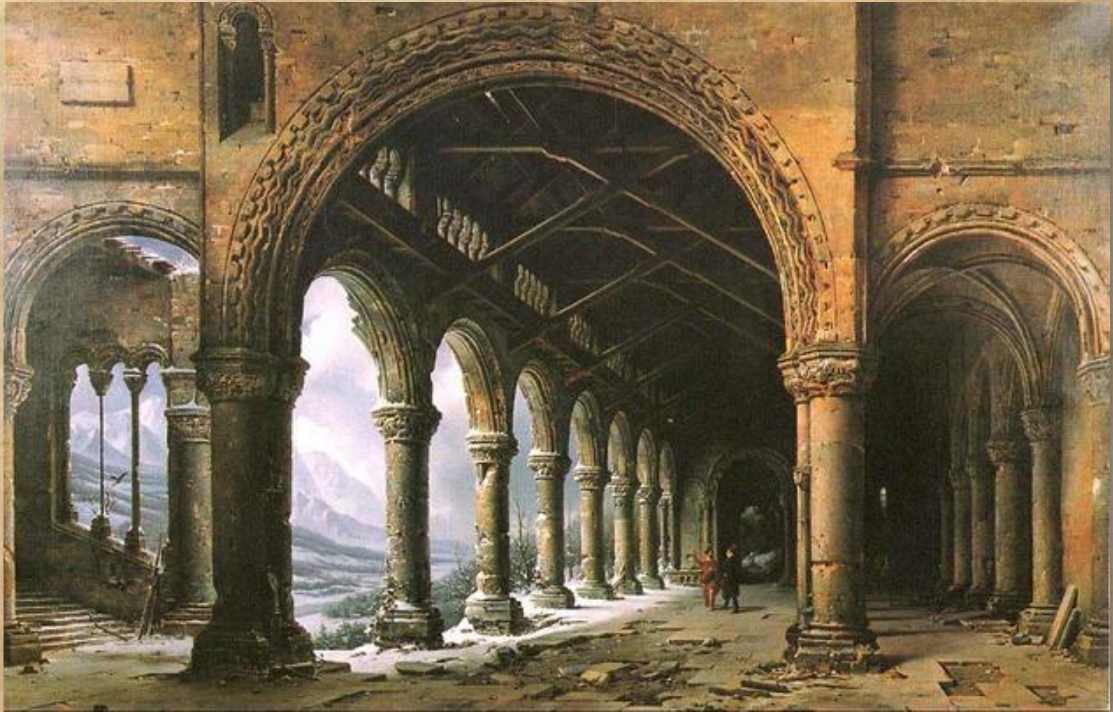
Рис. 1 - Полотно диорамы