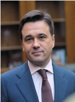
Губернатор Московской области ВОРОБЬЕВ АНДРЕЙ ЮРЬЕВИЧ