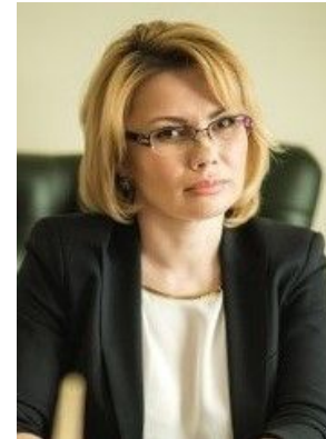
Уполномоченный по правам человека в Московской области СЕМЕНОВА ЕКАТЕРИНА ЮРЬЕВНА