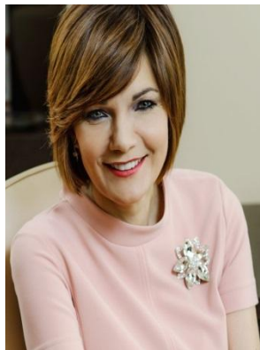
Уполномоченный по ребенка в Московской области МИШОНОВА КСЕНИЯ ВЛАДИМИРОВНА