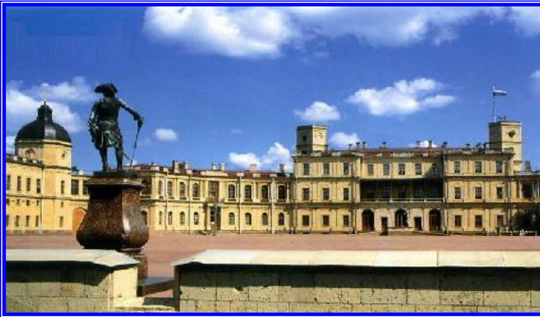
Дворец Павла I в Гатчине

В 1781-1782 гг. Павел и Мария Федоровна совершили путешествие по Европе. Во время поездки Павел вел себя неосторожно, открыто критикуя политику Екатерины. Это стало известно Екатерине, которая по возвращении сына удалила его от двора, подарив Гатчину , где Павел проводил отныне большую часть времени.