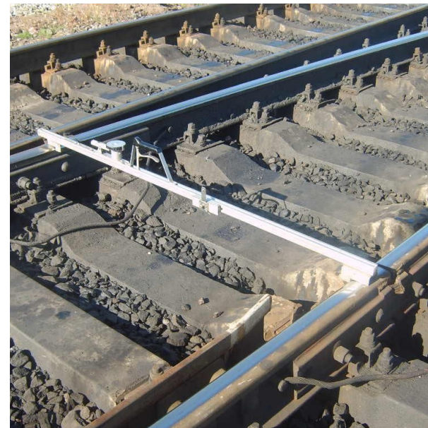
Задний стык крестовины (К)