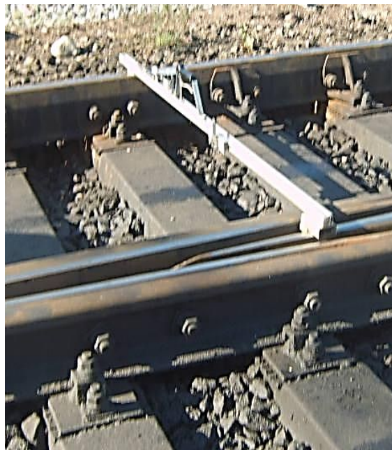
Сердечник крестовины в сечении 40 мм (И)