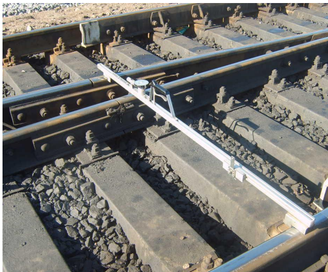
Передний стык крестовины (З)