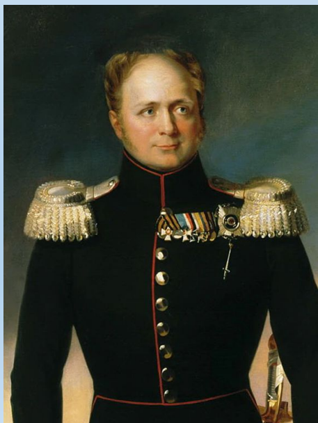
Александр I (1801 – 1825 гг.)