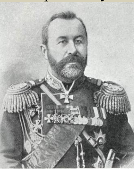
Генераль-адъютантъ А. Н. Куропаткинъ,