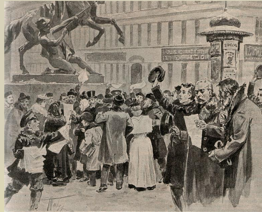
Вестник манифеста 28-го января в Петербурге, у Анничкова моста. Ориг. рис. (собств. «Нивы») В. А. Табурина, авт. «Нивы»

Характер войны: несправедливый, захватнический со стороны всех её участников