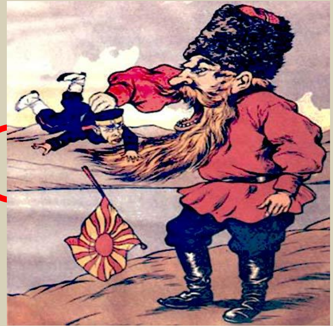
русский пропагандистский плакат 1904 г.

Справка: Военно-морское присутствие России в бухте Циньхуандо позволяло ей проводить активную политику как в Китае, так и на корейском полуострове.