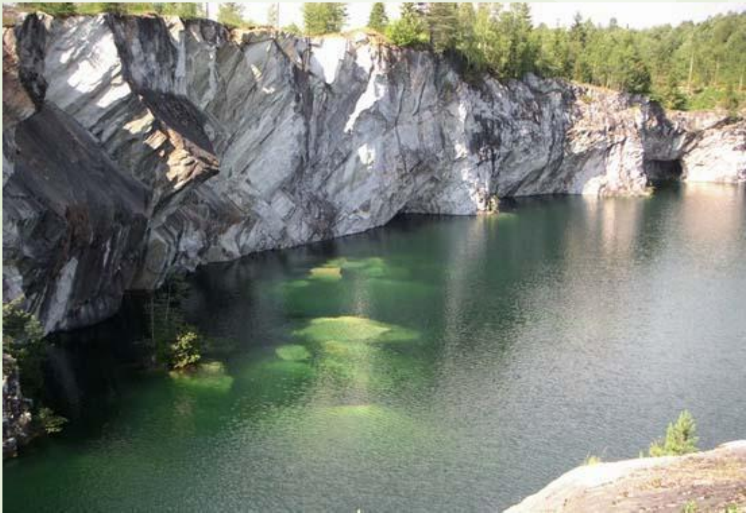
Горный парк Рускеяла