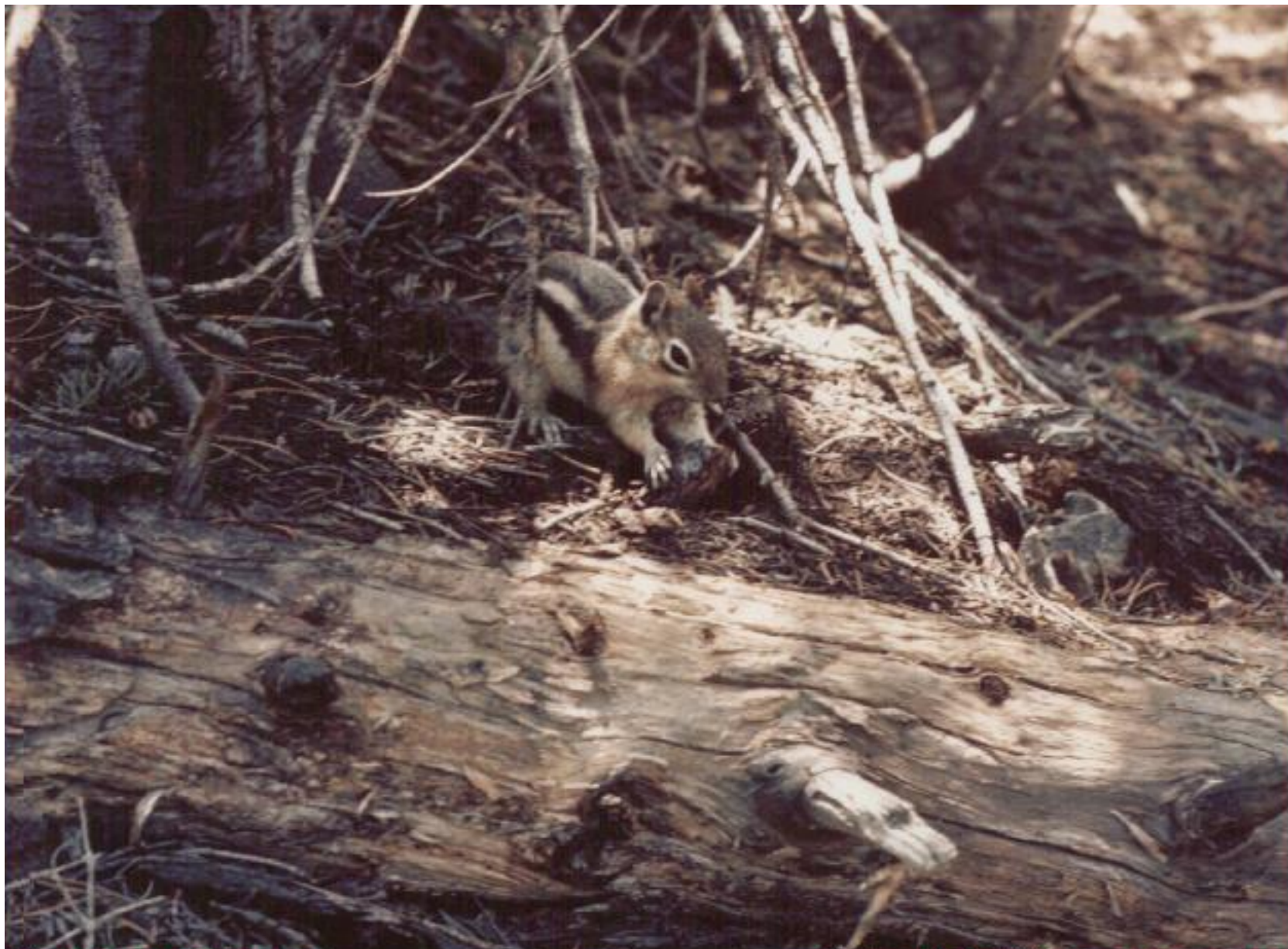
... весёлый бурундучок.