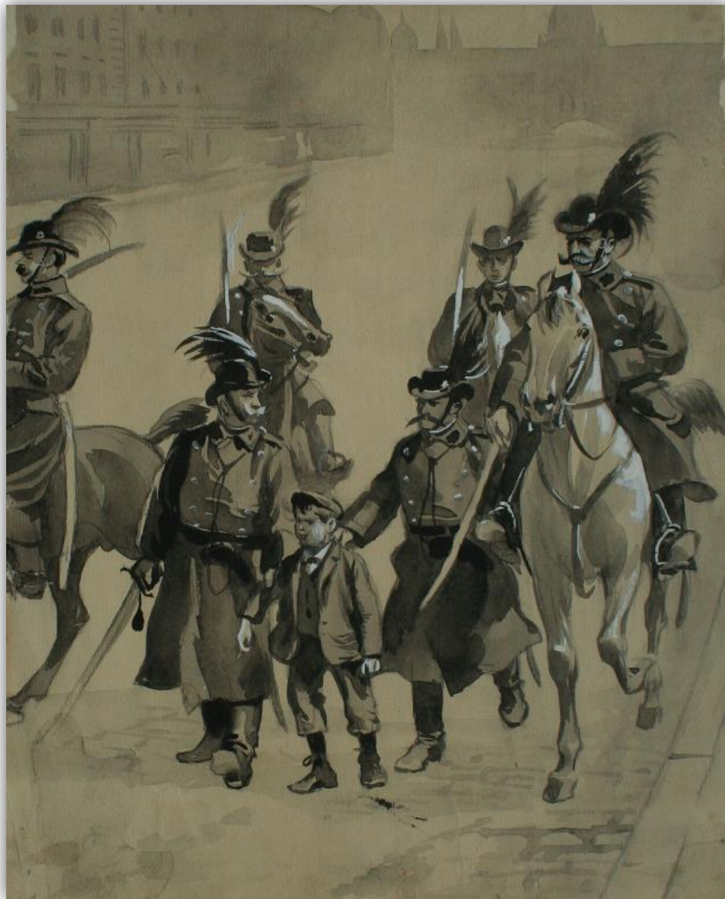
Demonstrace v Praze 1897