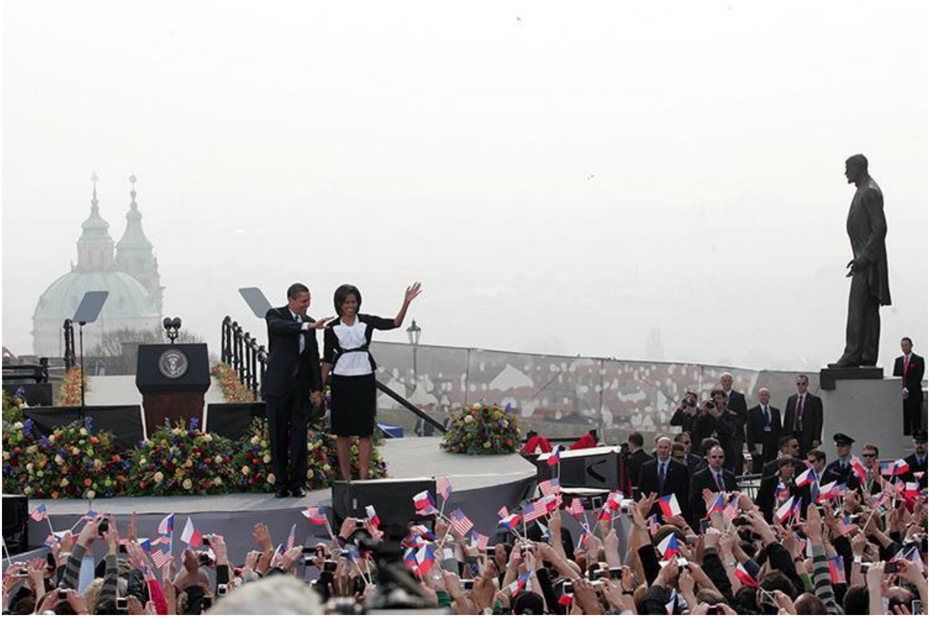
Pražané vítají světové válečníky...