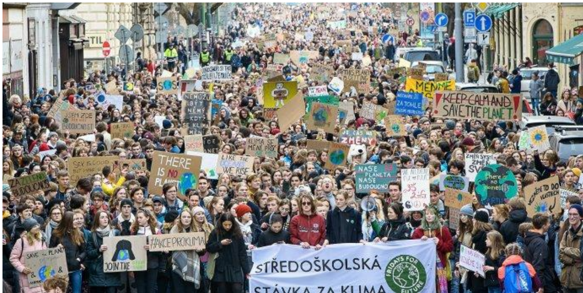
Pražané se schází kvůli klimatu – 2018 – ať žije Gréta...