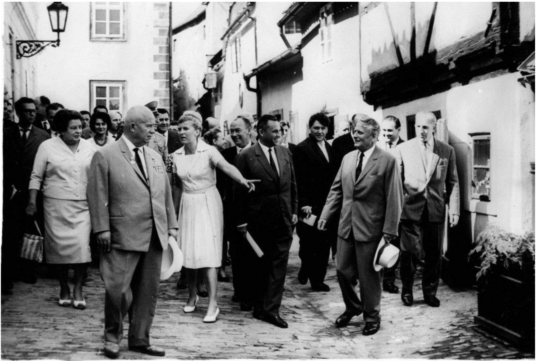
Září 1966, pražané a Nikita Chruščov