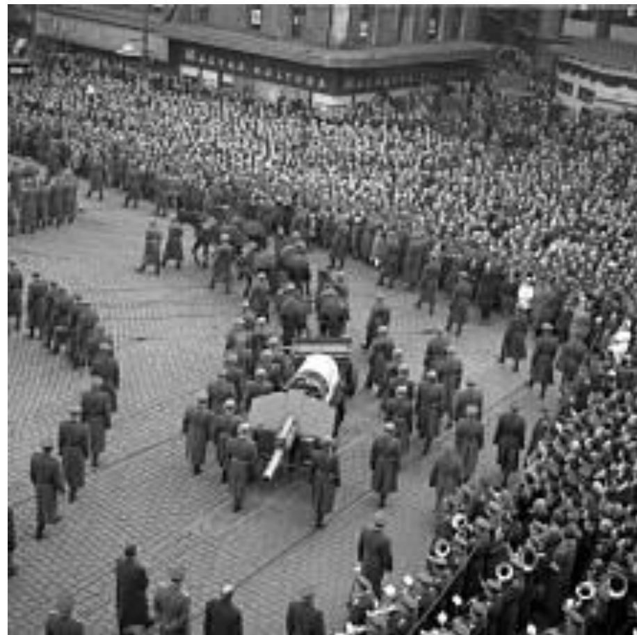
Klement Gottwald Úmrtí: 14. března 1953, pražané se loučí...