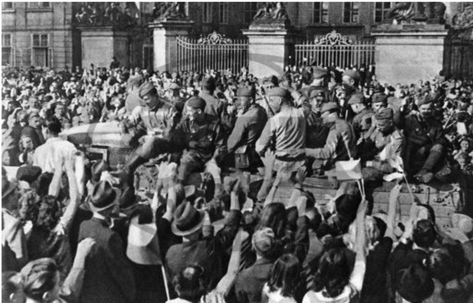
Praha, Hradčanské náměstí, Rudá armáda, sovětští, ruští vojáci, osvobození, vítání...