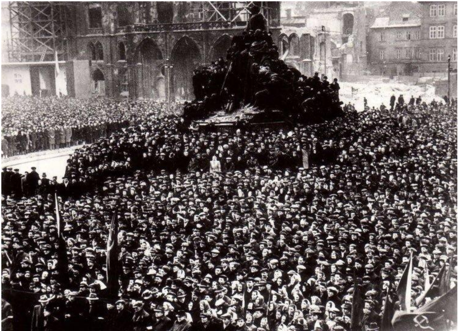
Staroměstské náměstí, pražané slaví Vítězný únor 1948.