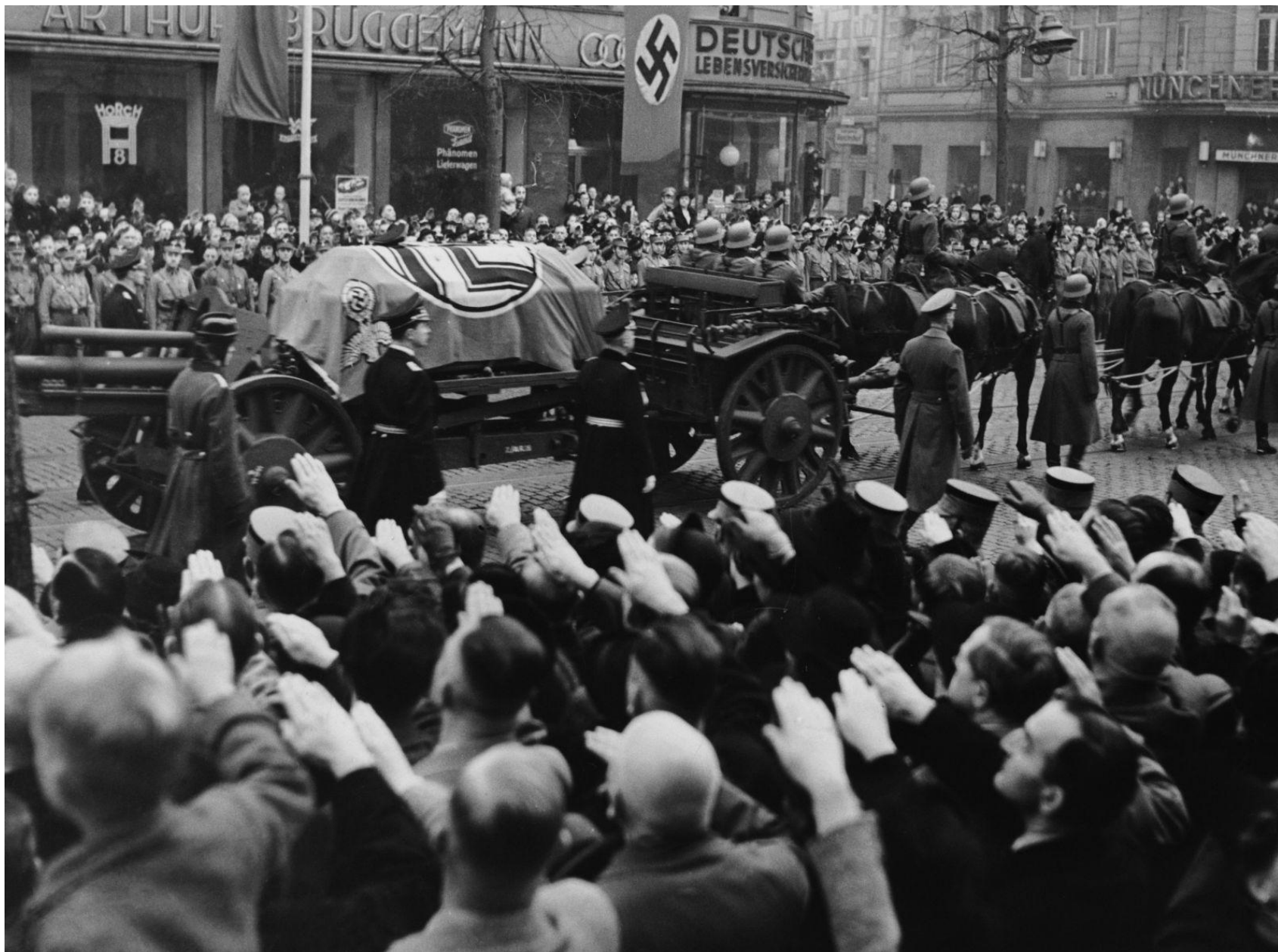
Reinhard Heydrich - rozloučení pražanů s katem...