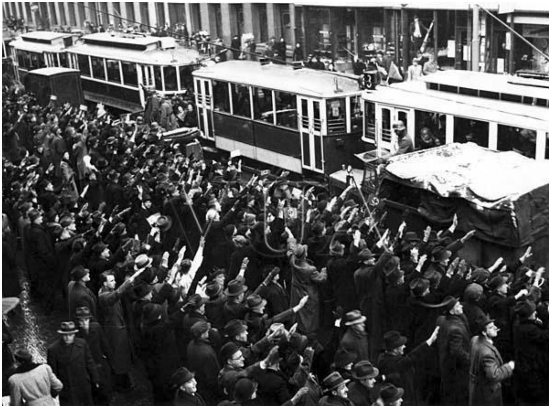
Výmluvné obrázky pražských ulic z 15. března 1939.