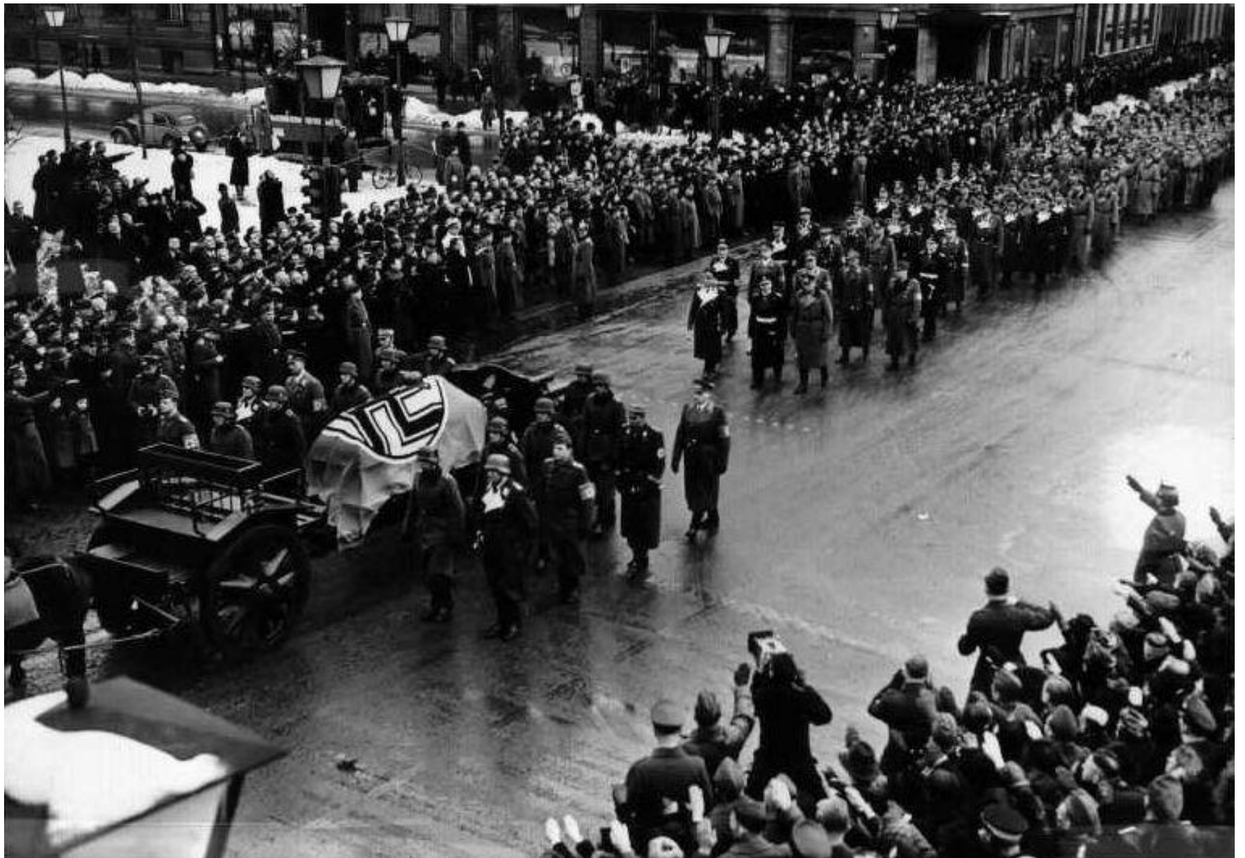
Reinhard Heydrich - rozloučení pražanů s katem...