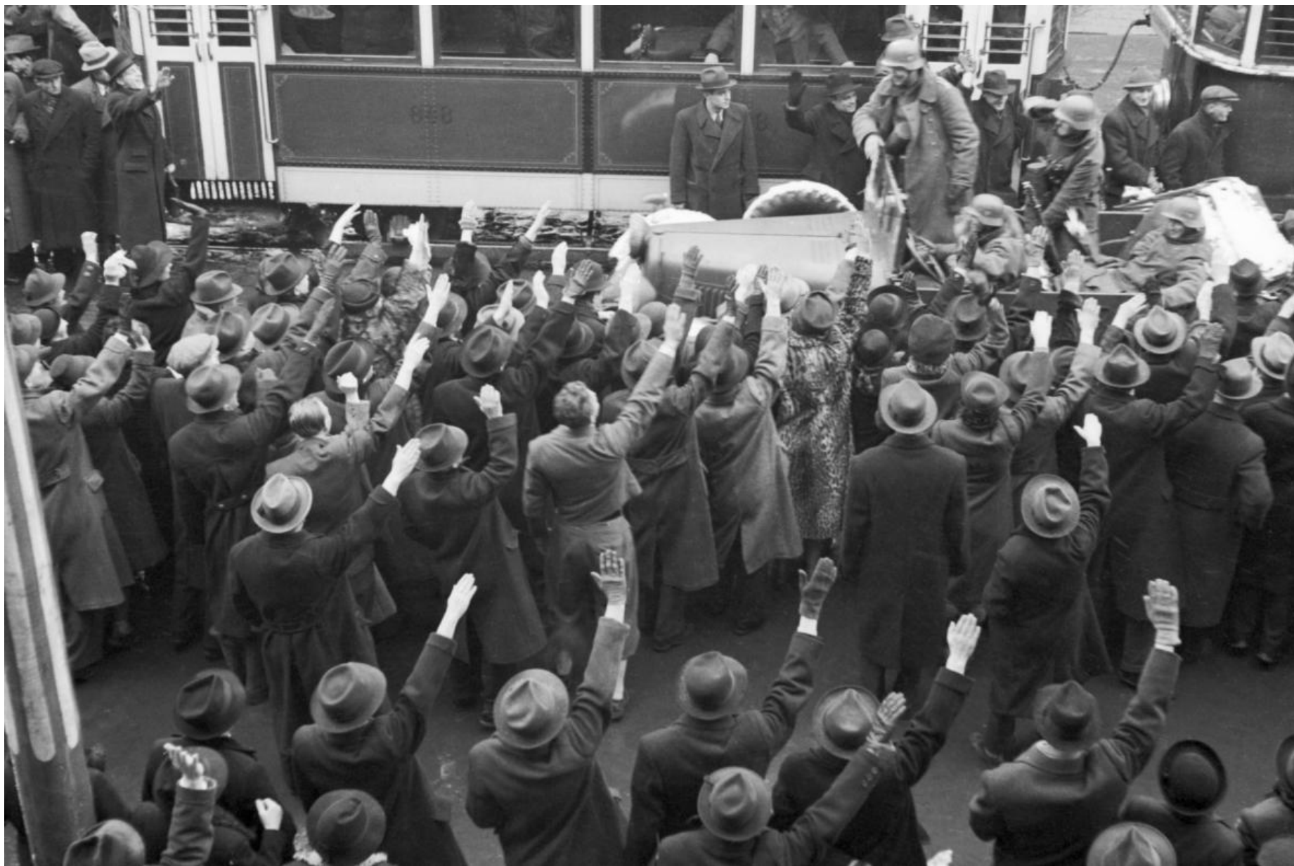
Výmluvné obrázky pražských ulic z 15. března 1939.