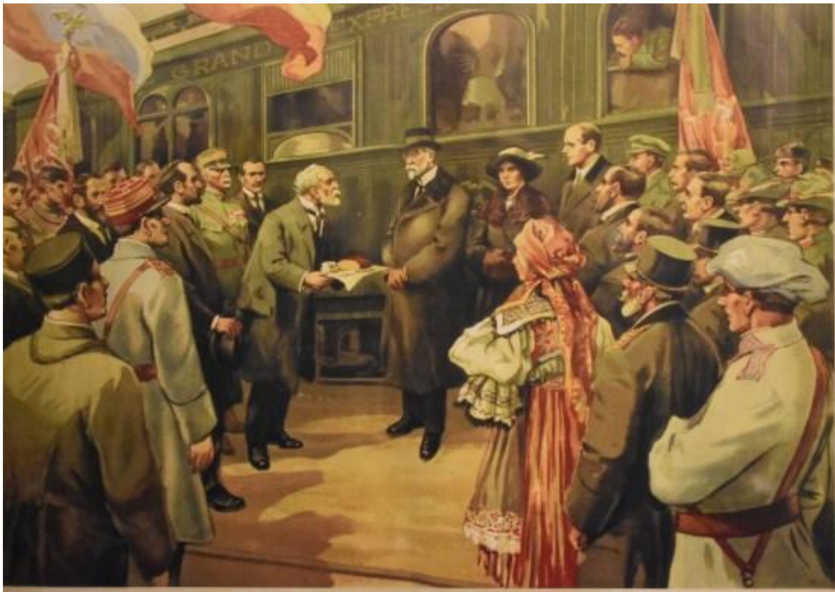
Příjezd T. G. Masaryka prosinec 1918