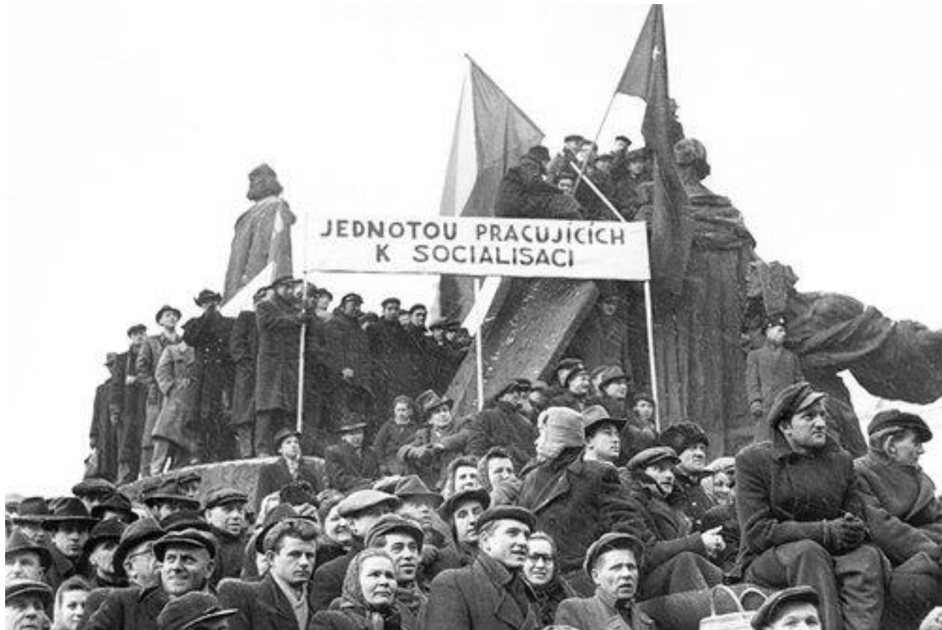
Pražané slaví Vítězný únor 1948