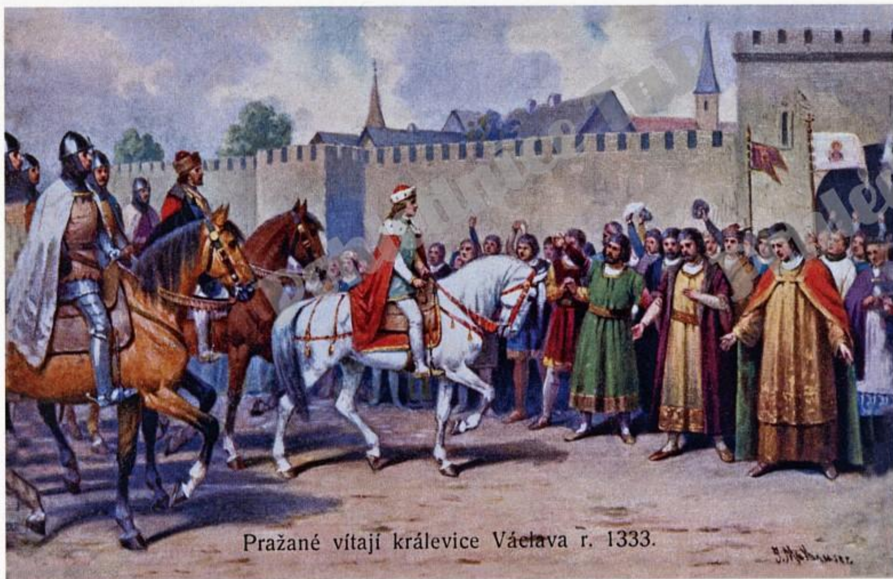
Pražané vítají královce Václava r. 1333.