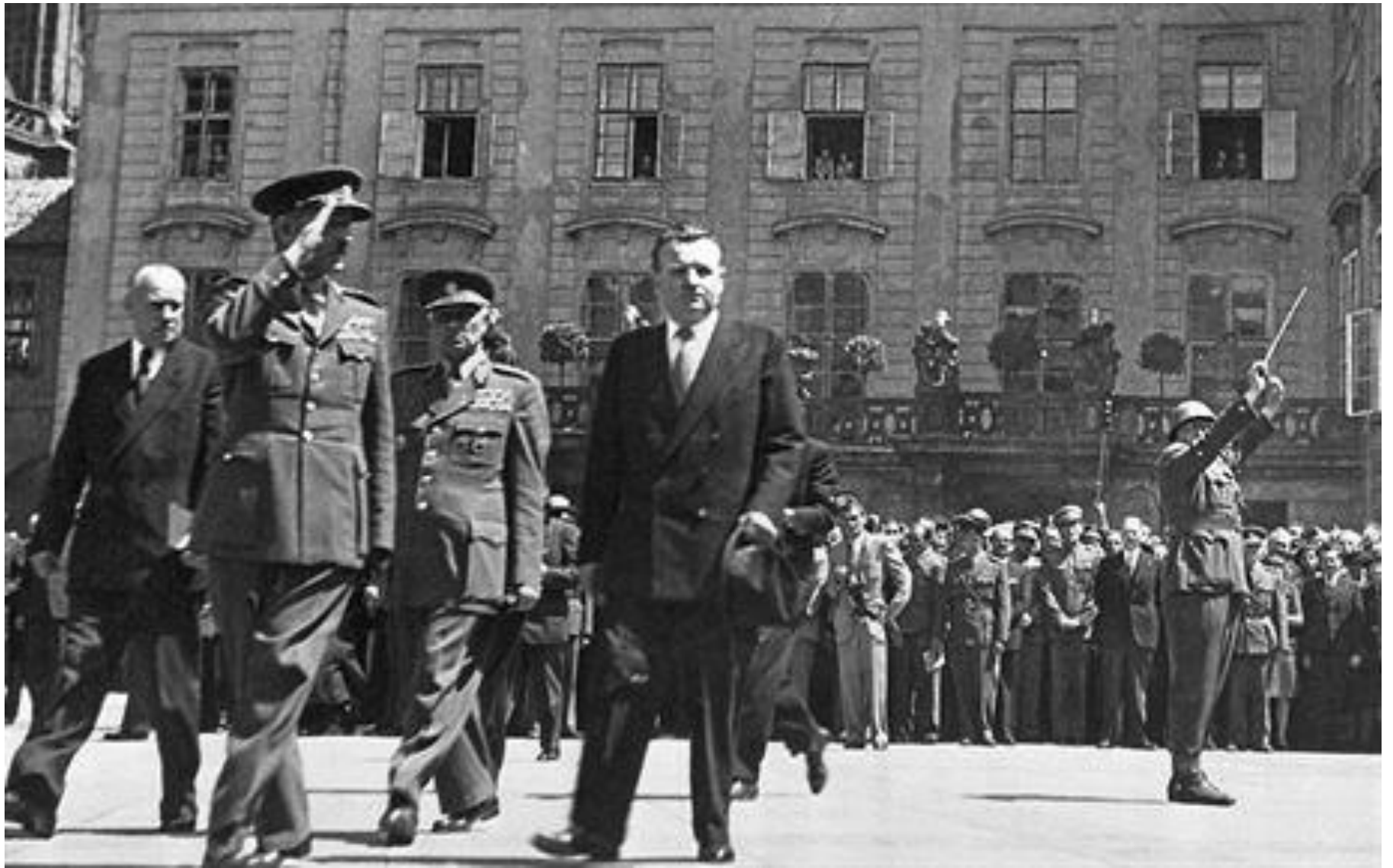
Gottwald na Hradě