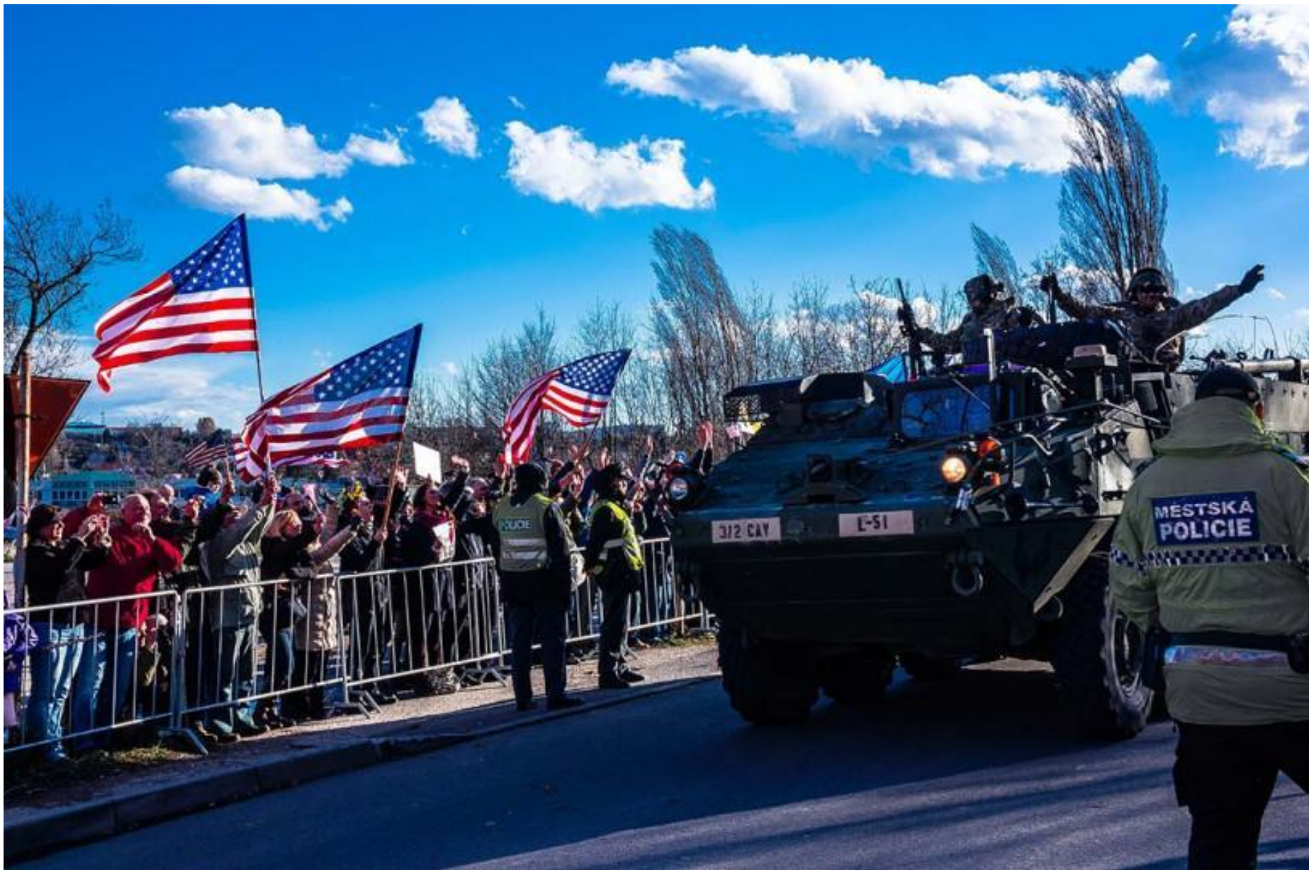
Pražané vítají světové válečníky...