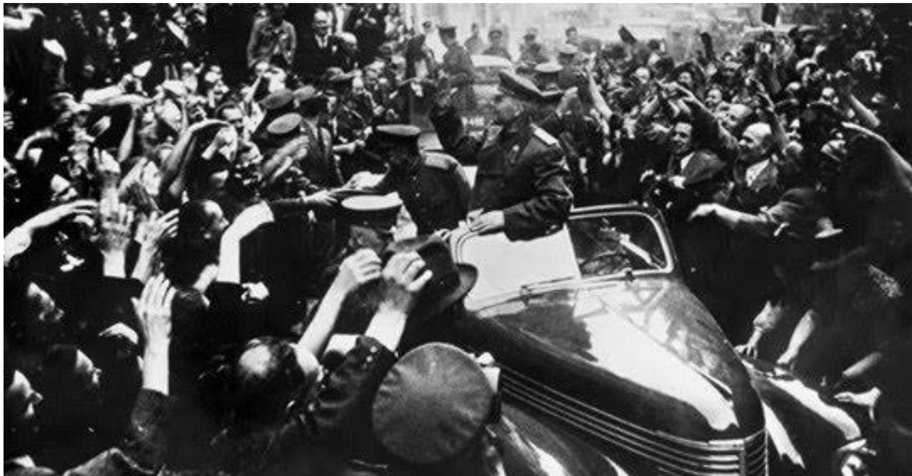
Maršál Koněv v Praze... a jeho pražané.