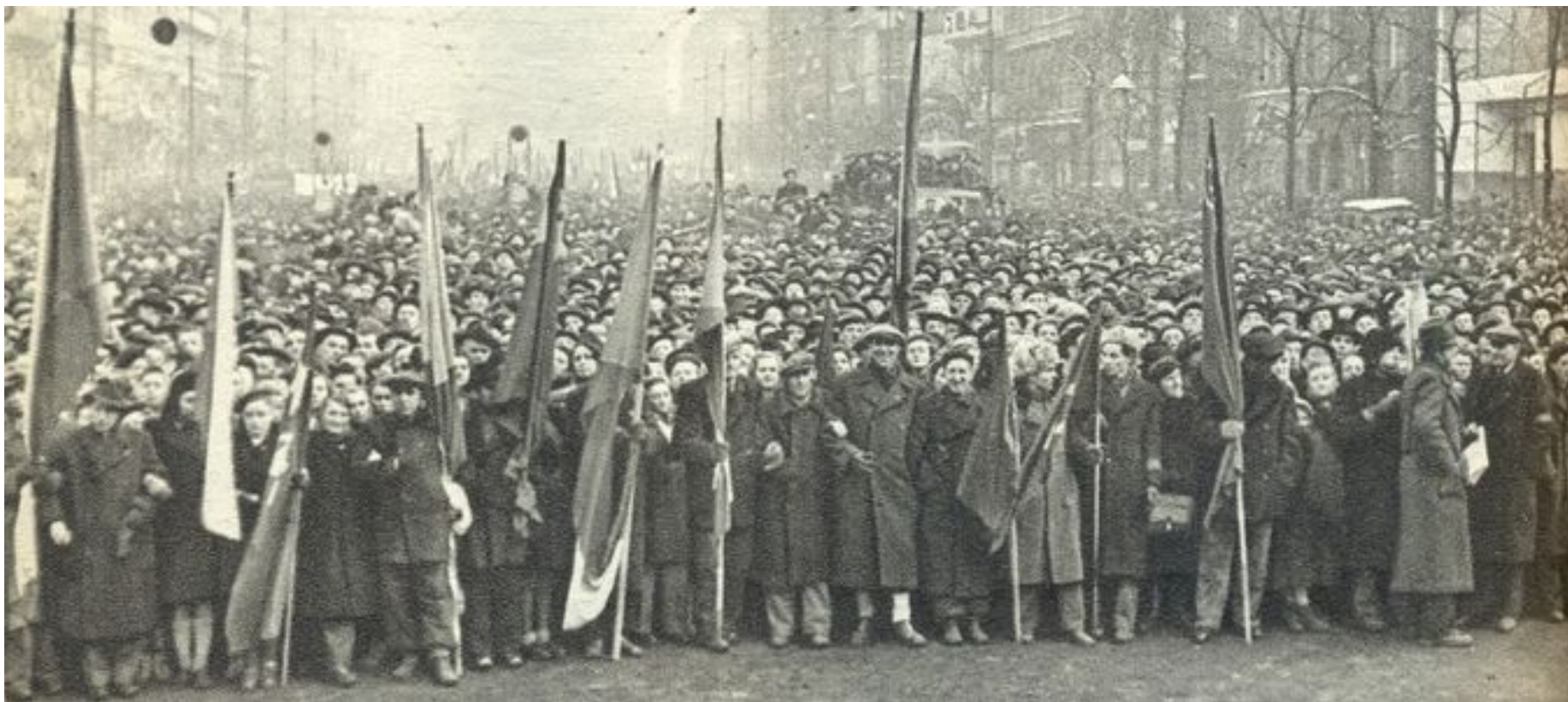
Pražané slaví Vítězný únor 1948...