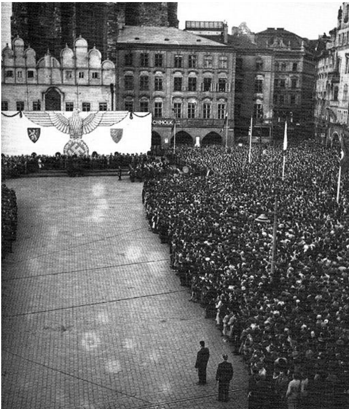
Manifestace na Staroměstském náměstí v Praze 2. června 1942