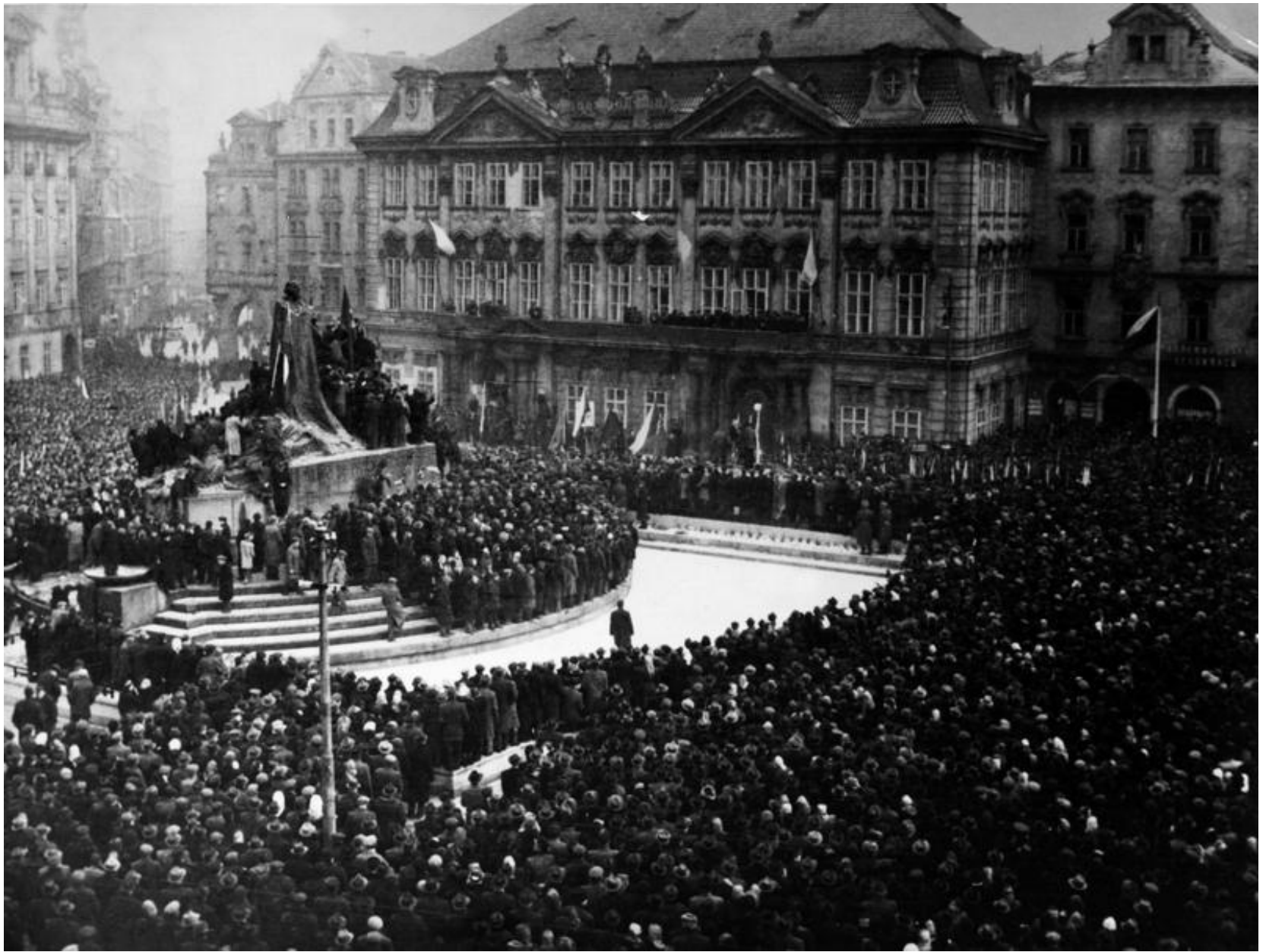
Projev Klementa Gottwalda poté, co dvanáct ministrů rezignovalo...