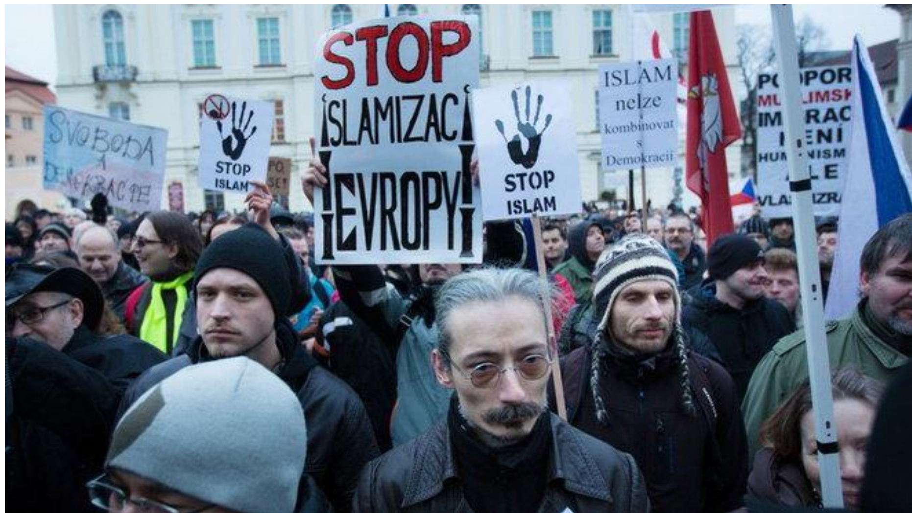
Pražané se schází aby zastavili islamizaci Prahy...