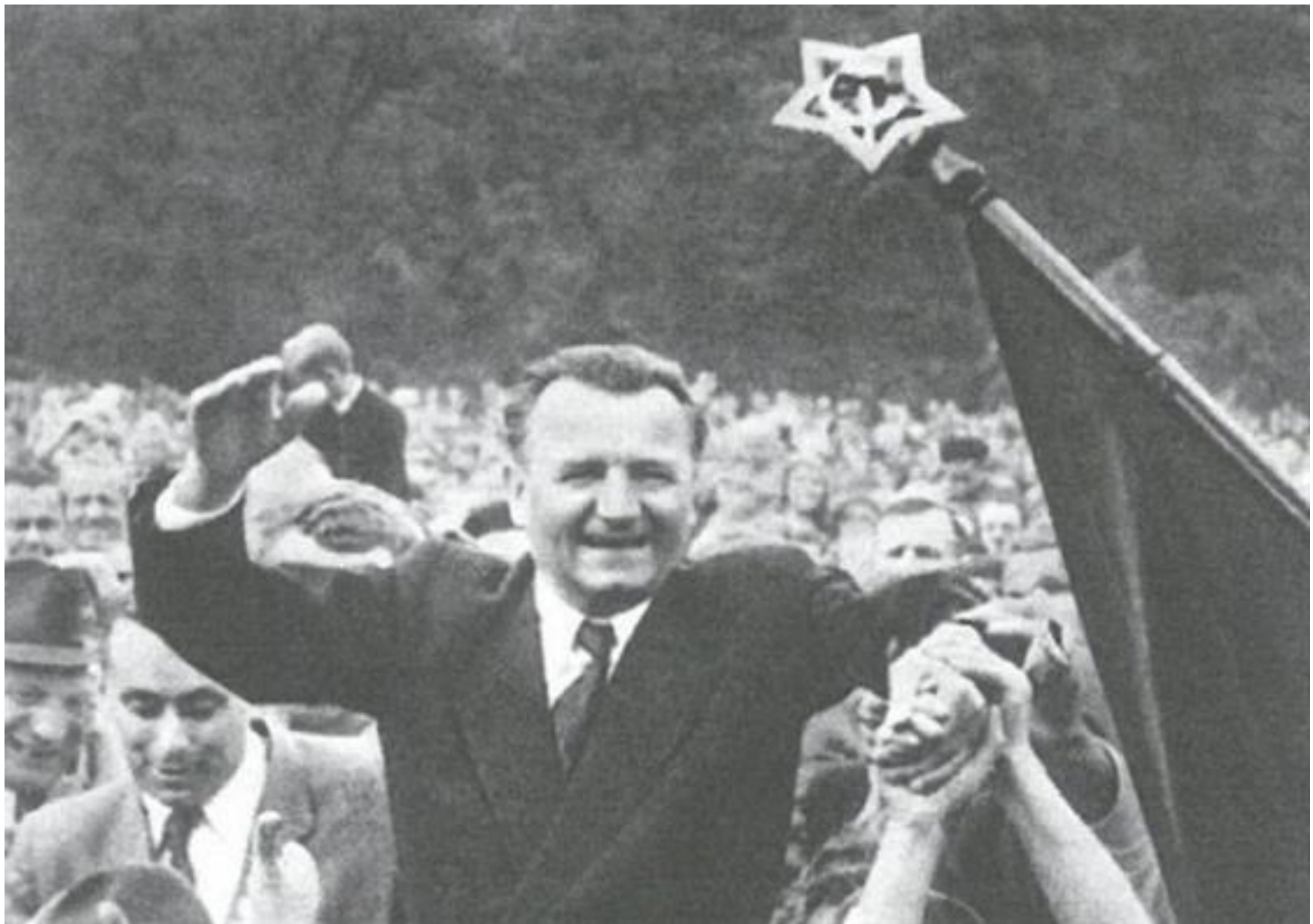
Klement Gottwald jako oblíbený předseda československé vlády v roce 1946