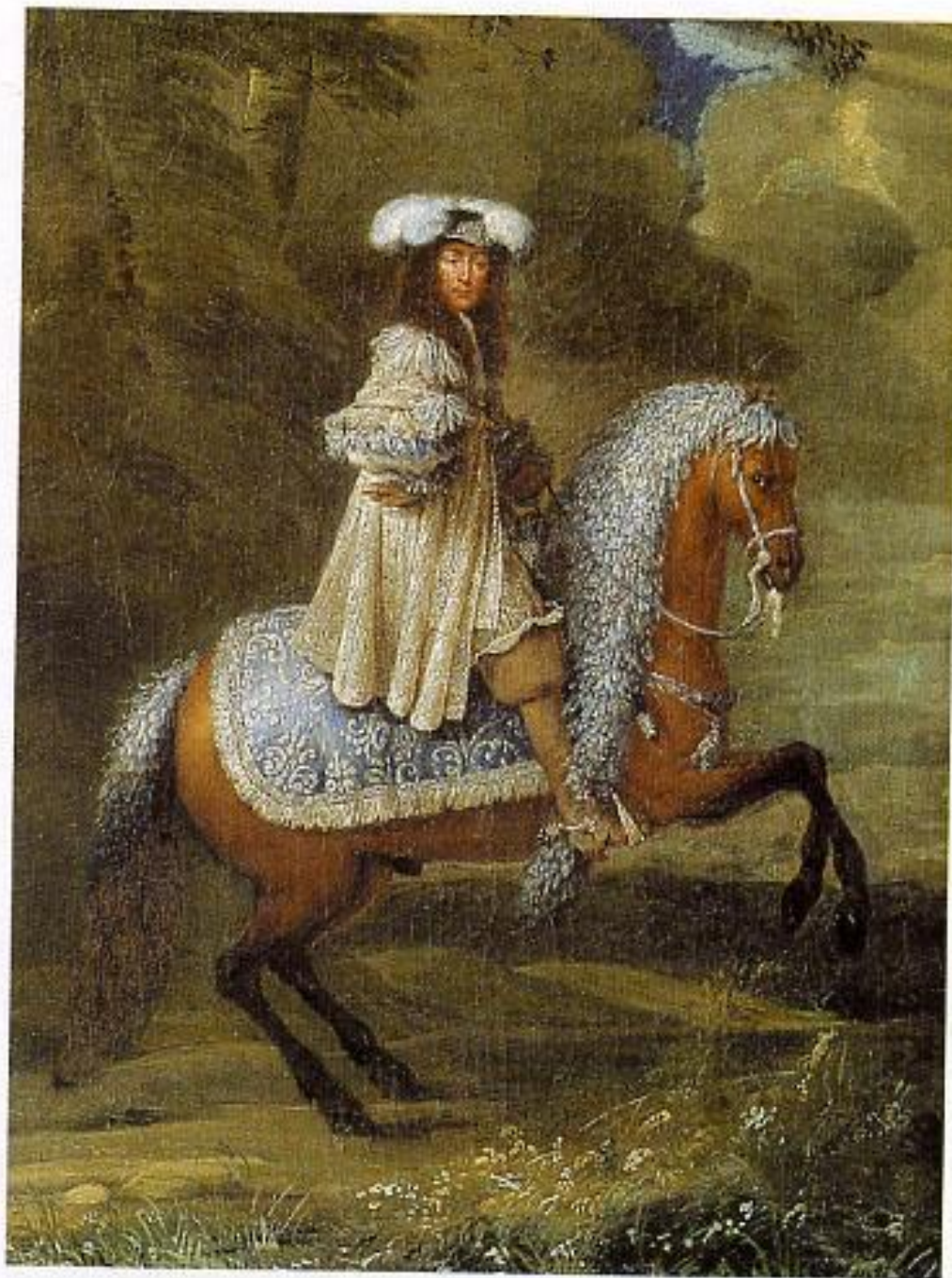
Неизвестный художник. Портрет всадника в золубом. Вторая половина XIX в.