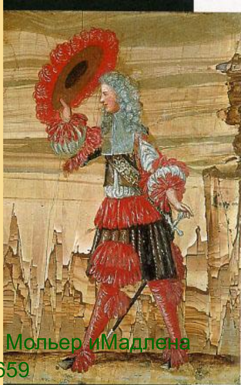
Неизвестный художник. Мольер в роли