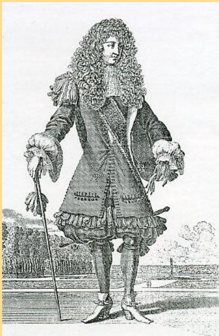
« Лепотр. Щёголь. 1660 г. Ранняя форма юстокора.