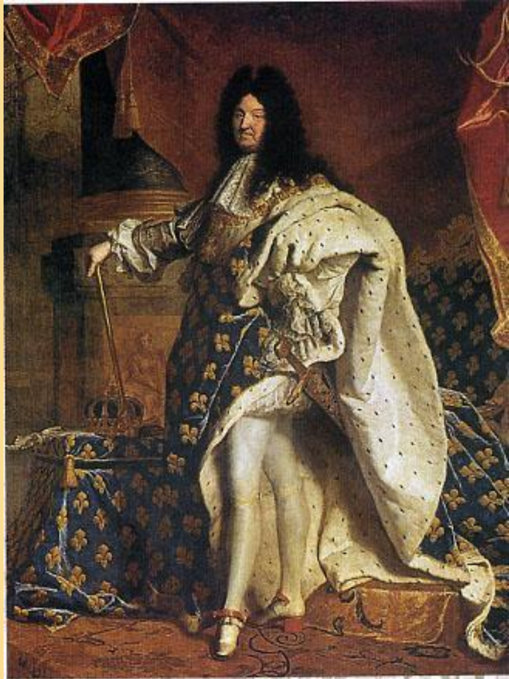
Гиацинт Риго. Людовик XIV в королевском облачении. 1701 г. Лувр. Париж.

Гиацинт Риго. Людовик 14 в королевском облачении 1701 г. Лувр. Париж.