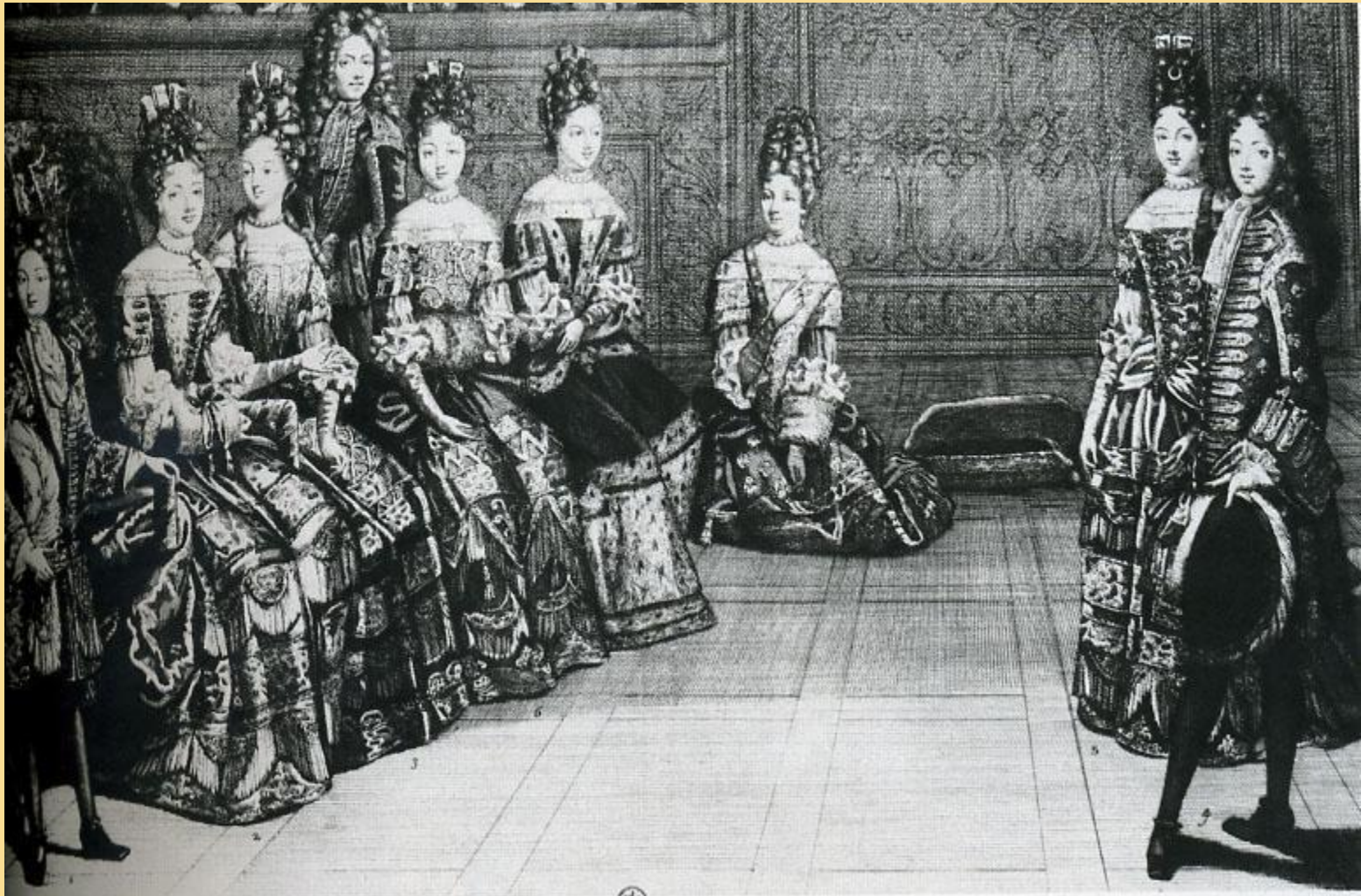
...herren an der die den Kopf der Schönen beflecket Die gehörigen Theile dazu woraus terin sie mit einem Strumpfband zusammen, und