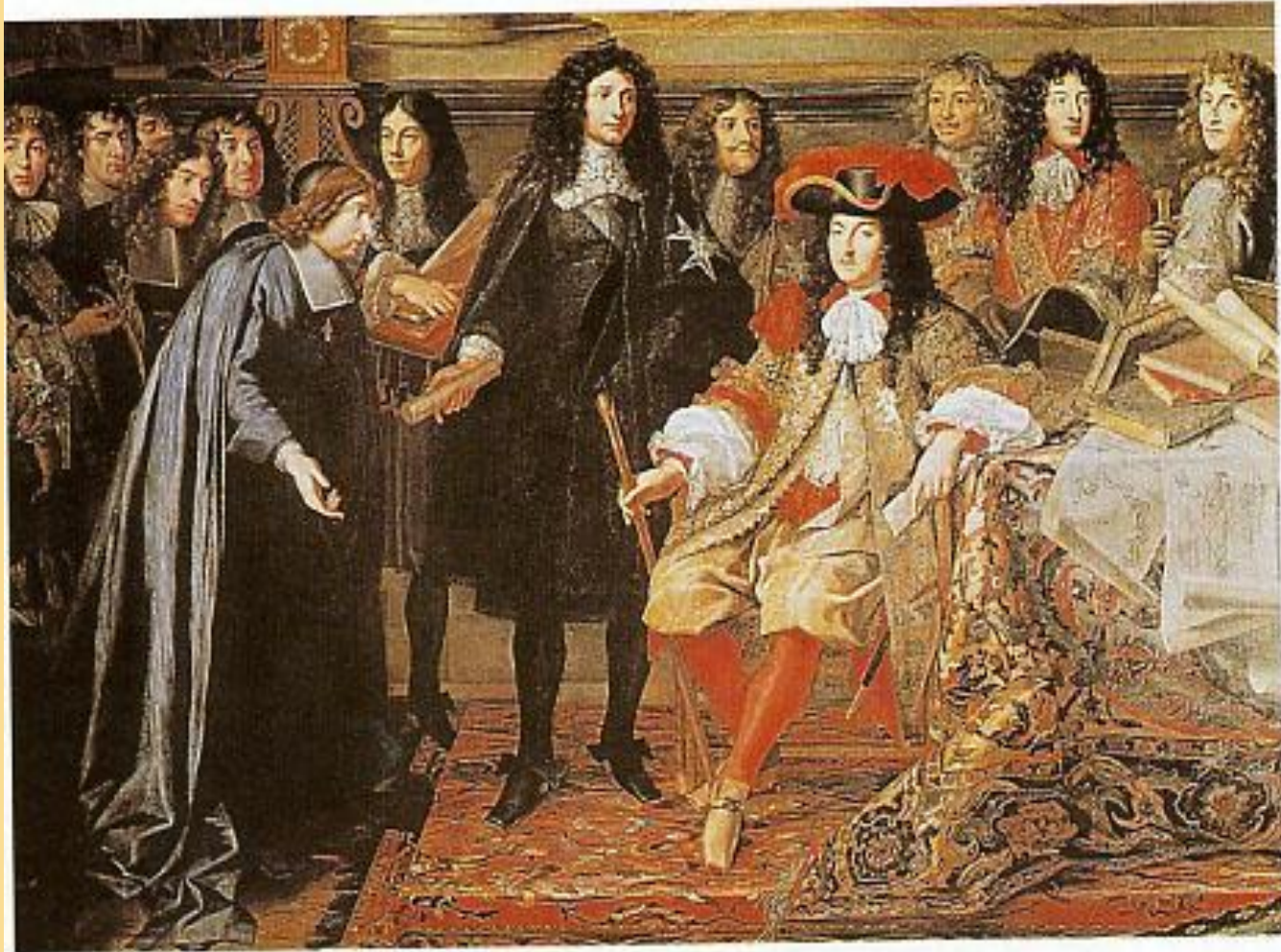
Шарль Леблен. Учреждение Академии наук. 1667 г. Версаль.

В центре- Людовик-14. Локоны парика в виде тугих горизонтальных валиков укладывались симметрично. Сзади доходили до лопаток, а спереди ниспадали до груди. На короле модная шляпа, ее поля загибаются с двух сторон, с годами шляпа все более превращается в реквизит , необходимый в церемониальных поклонах