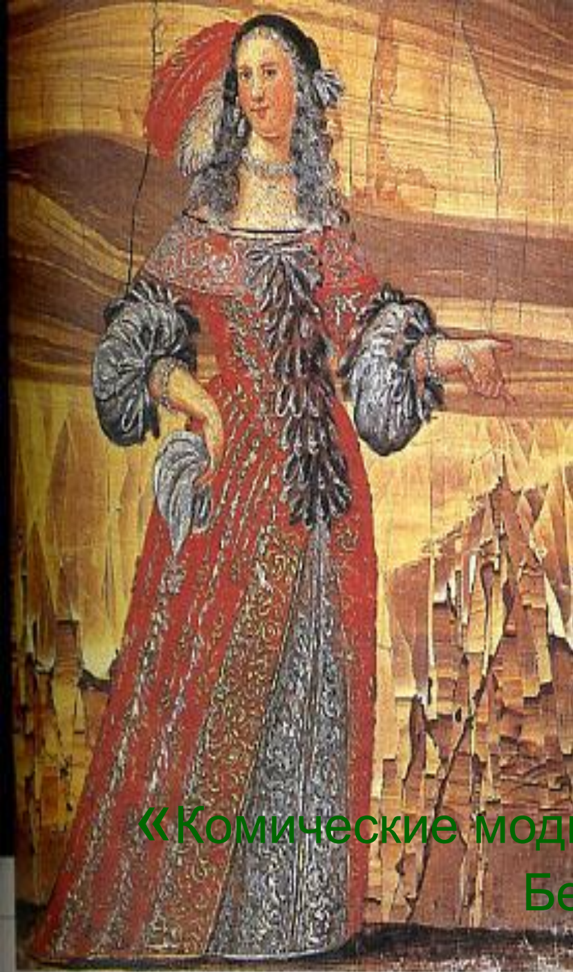
«Комические модники», Мольер и Мадлена Бежар 1659