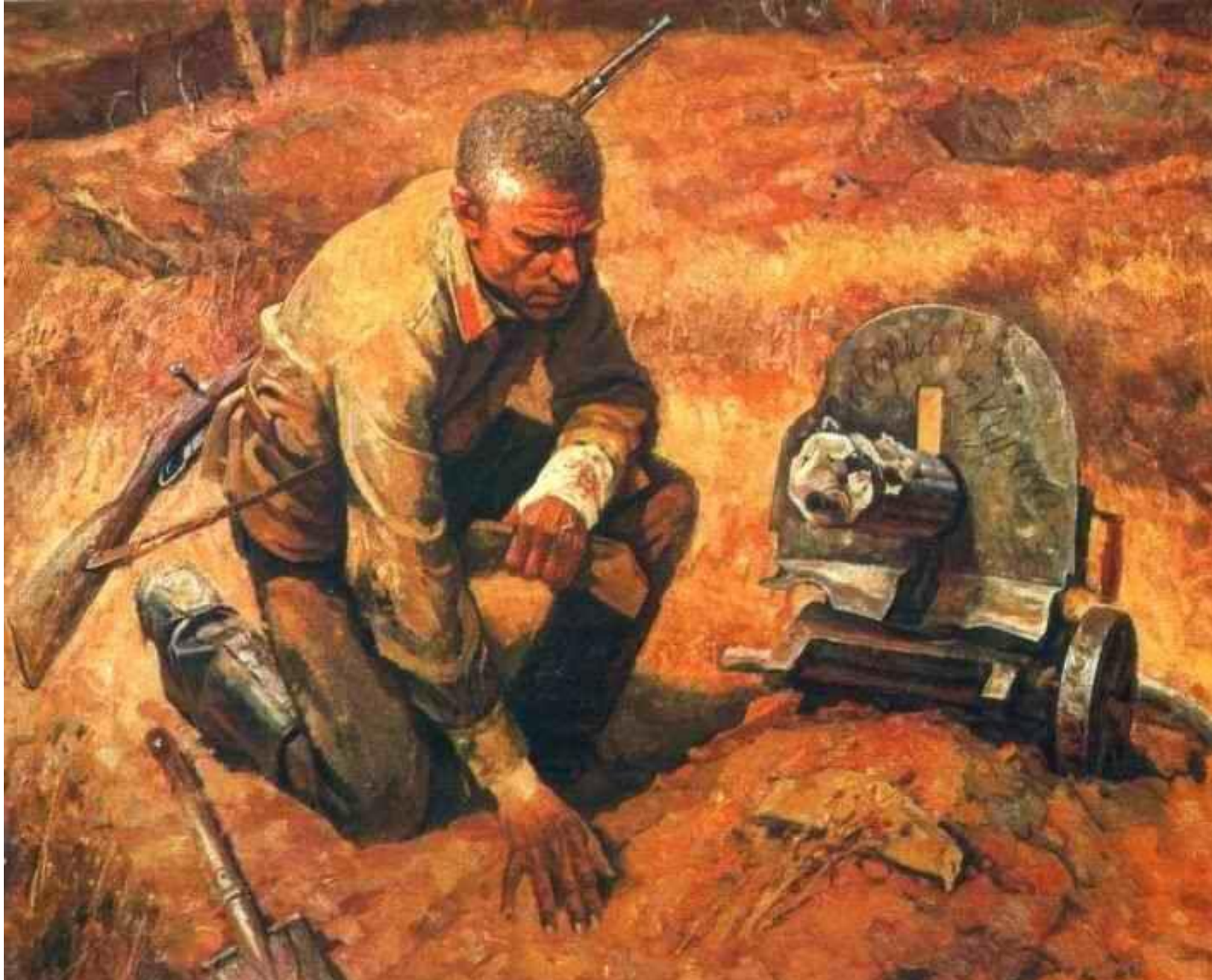
Б. Тарелкин. Товарищи. 1983