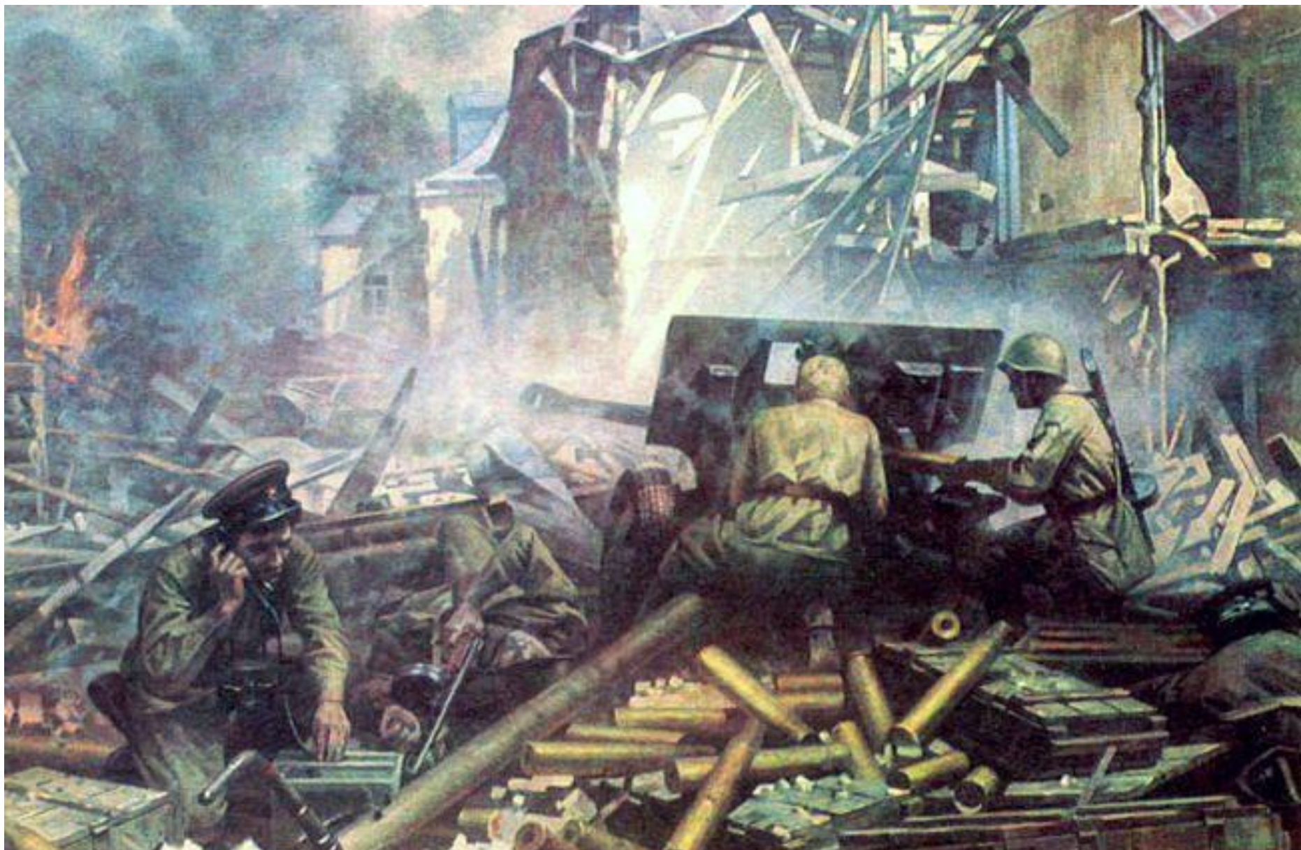
Г. Марченко. На окраине Сталинграда