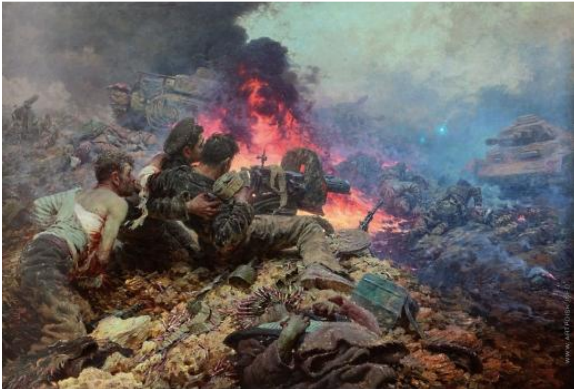
Волков Ю.В. Подвиг пяти черноморцев.1948