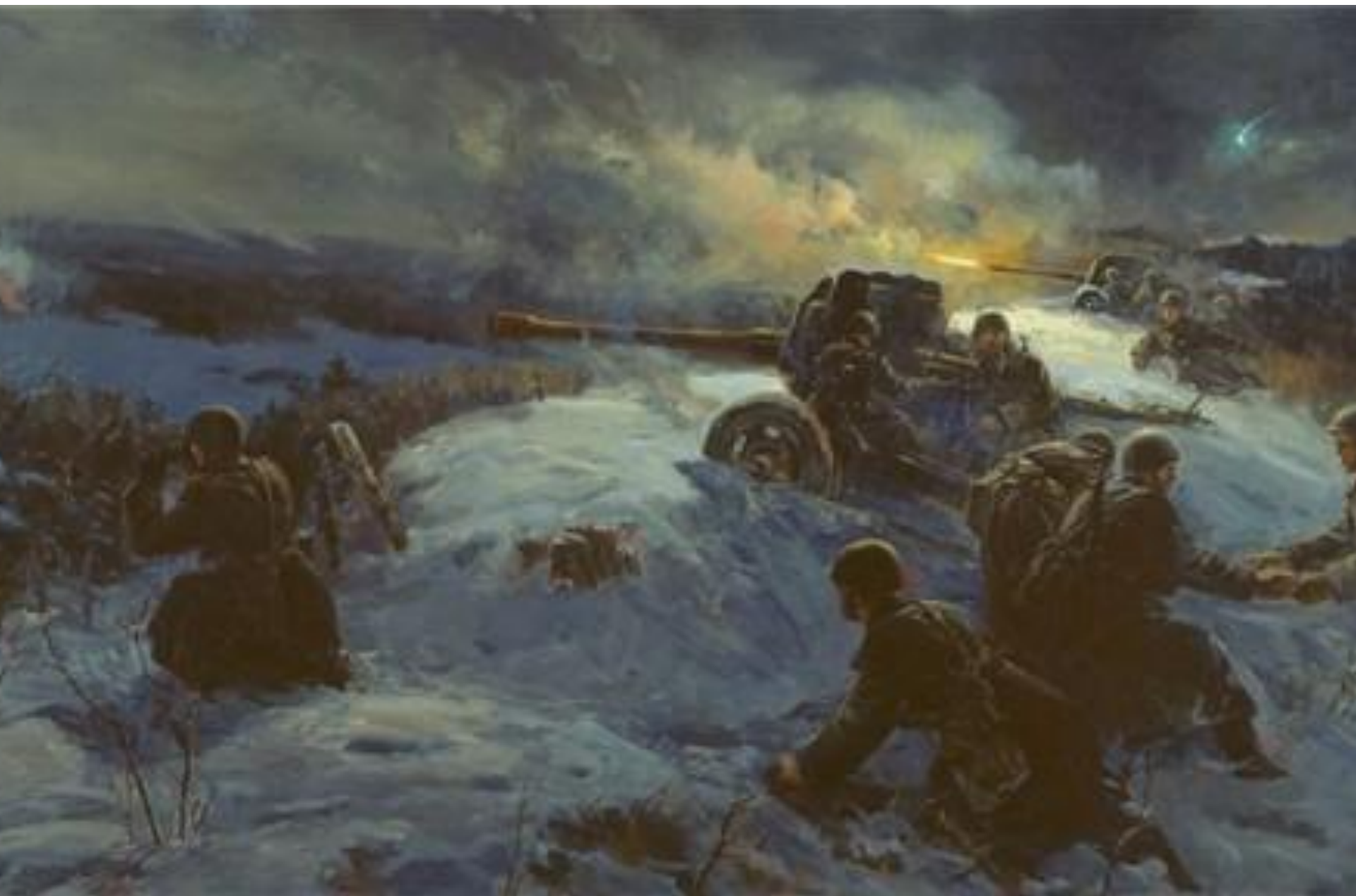
Ф. Усыпенко. Ночной бой. 1957 г.