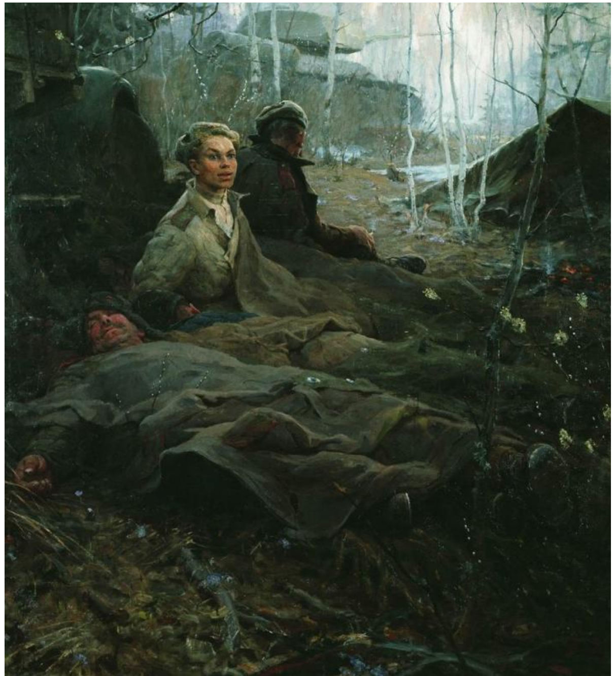
Б. Неменский. Дыхание весны