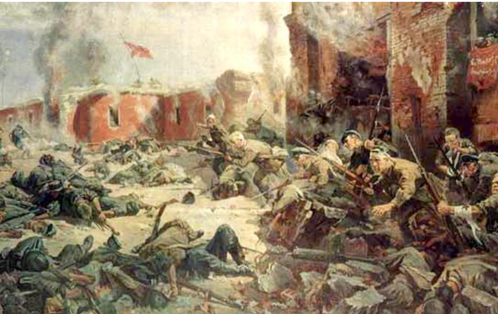
П.А.Кривоногов. Защитники брестской крепости (фрагмент), 1951.