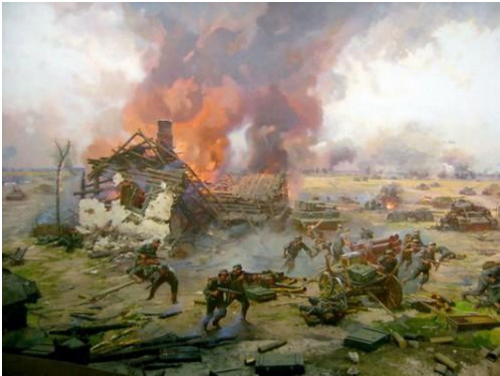
Н. Присекин. Курская битва. 1995 г. (фрагмент диорамы)