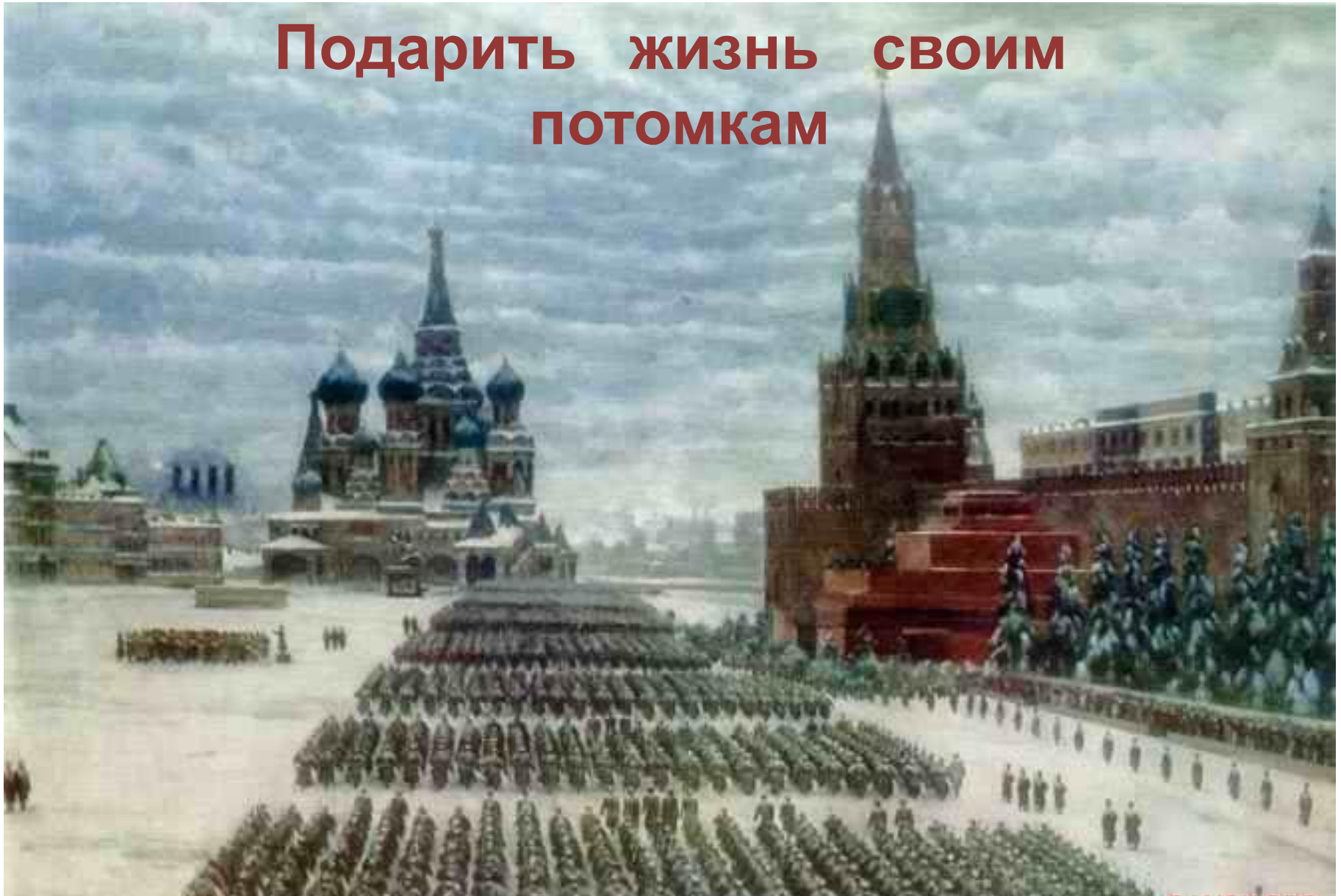
К. Юон. Парад на Красной площади 7 ноября 1941 года