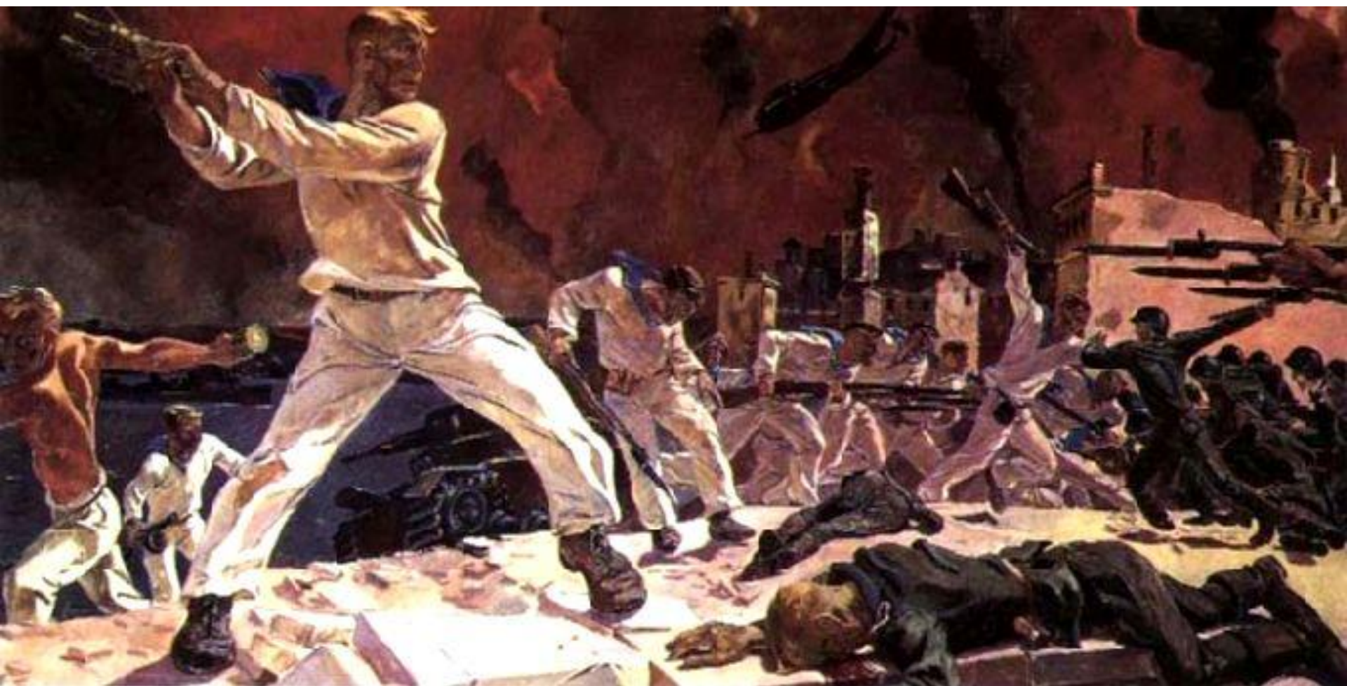
А. Дейнека. Оборона Севастополя. 1942