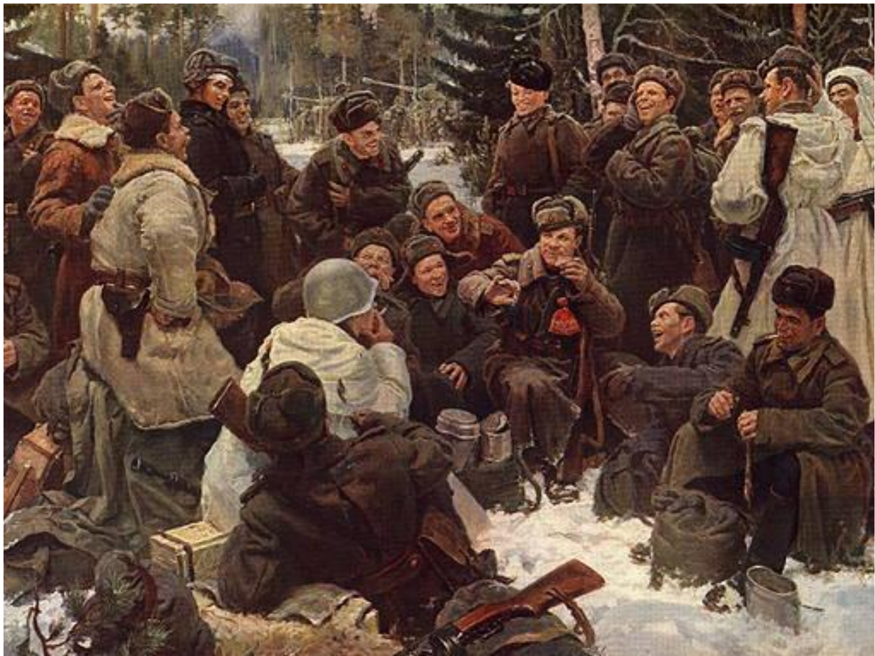
Ю. Непринцев. Отдых после боя. 1951