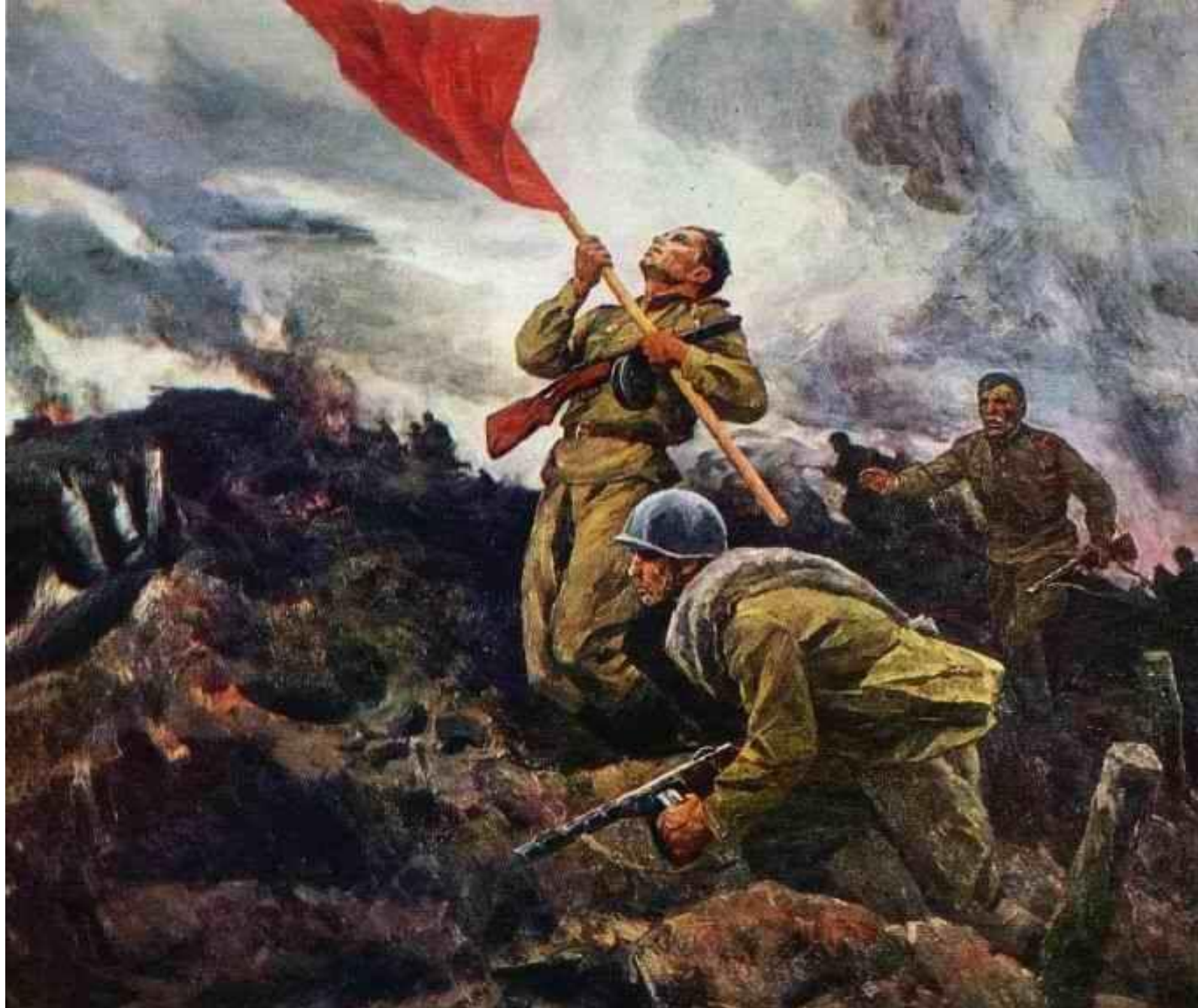
А. Широков. За Родину