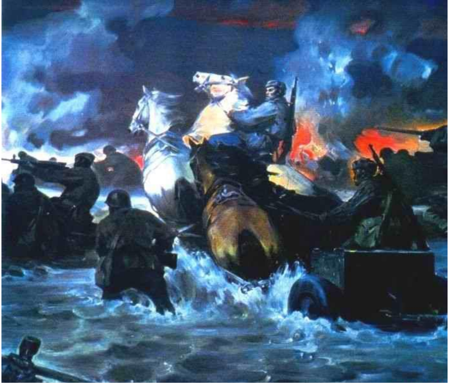
В. Шаталин. Битва за Днепр. 1983