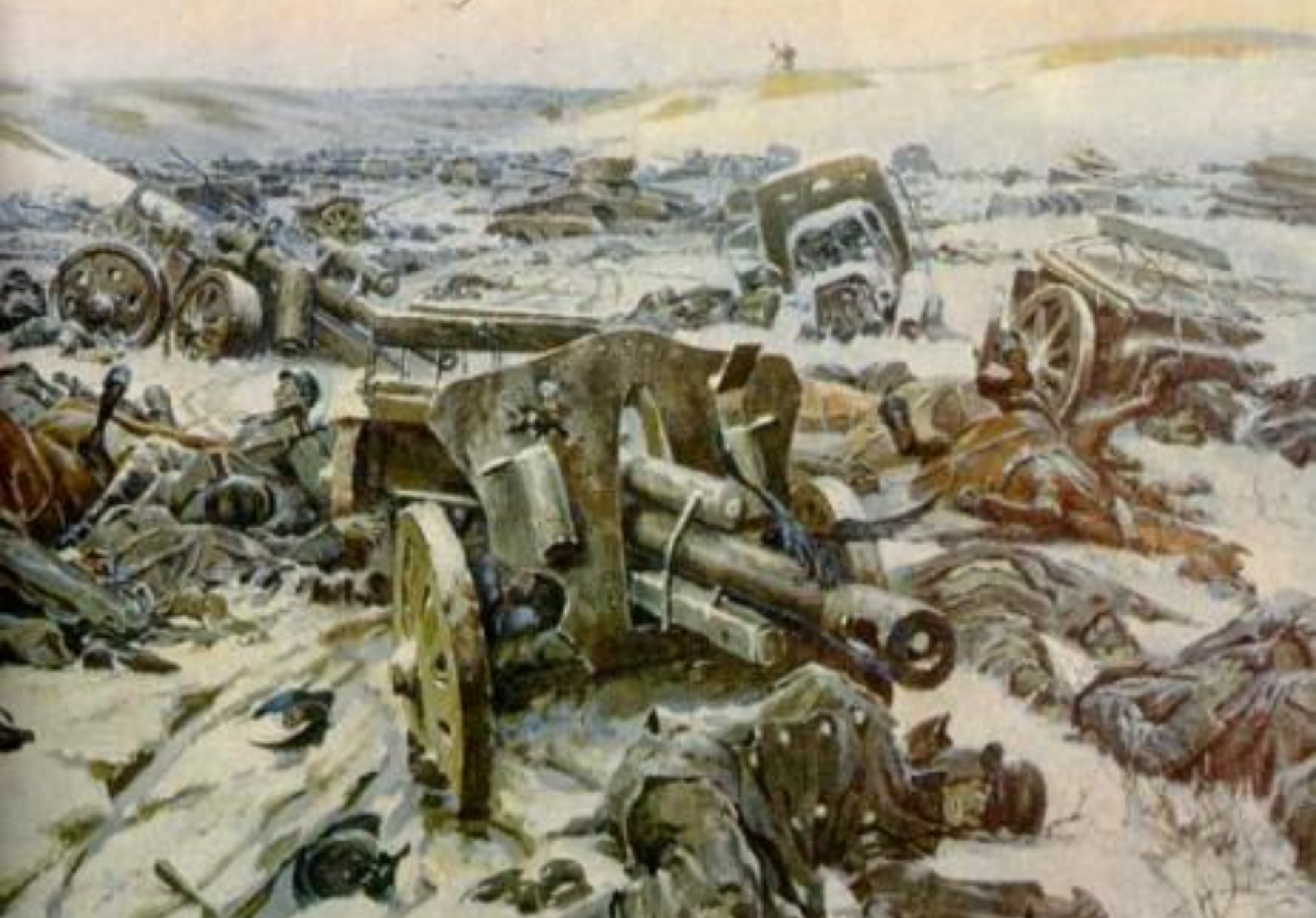
П.А. Кривоногов. Корсунь-Шевченковское побоище. 1945 г.