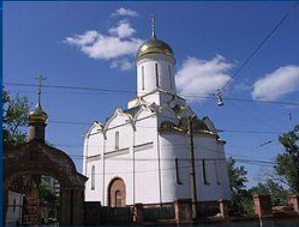
Храм Святой Троицы на площади Пушкина