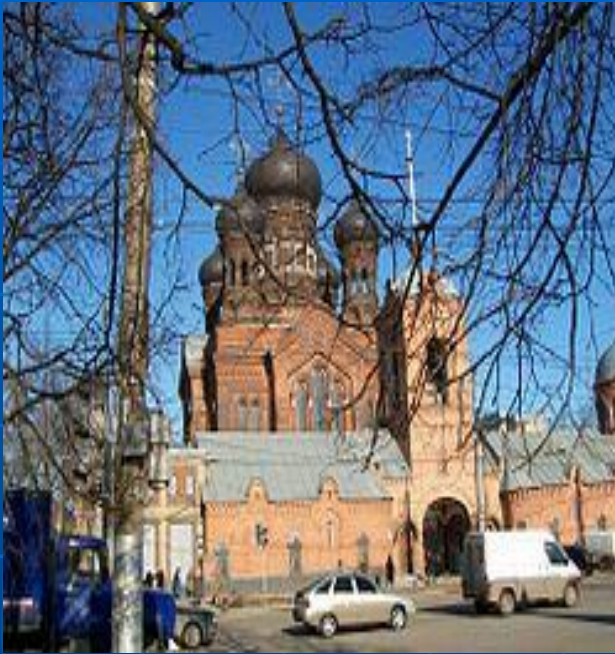
Иваново Иваново. Свято-Введенский монастырь