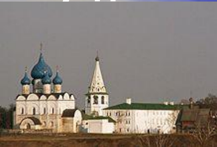
Суздаль Суздаль. Собор Рождества Богородицы