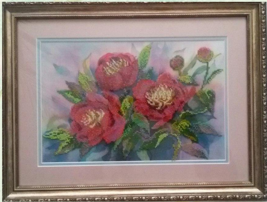
Вишивка бісером “ Півонія ”