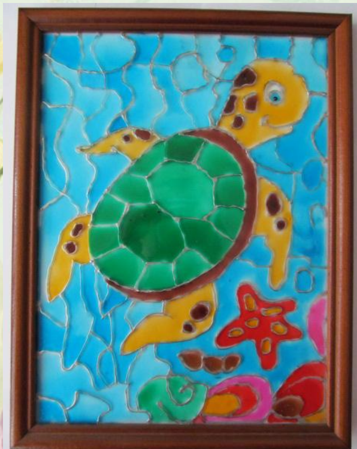
Робота виконана вітражними фарбами “Море ”