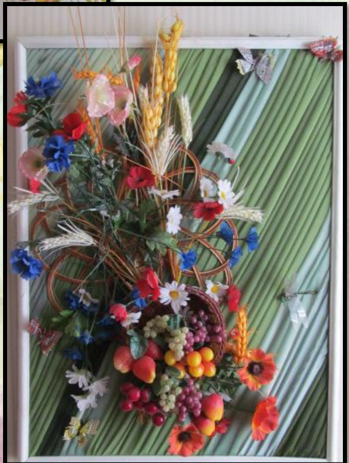
Панно “Літні спогади ”