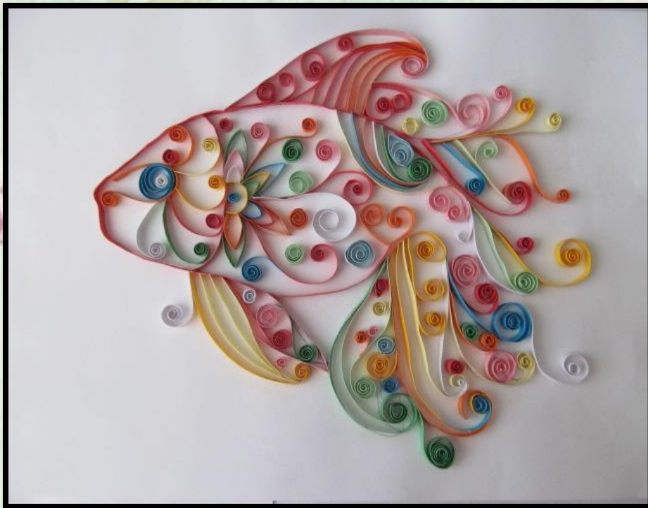
Робота виконана в стилі квілінг “Золота рибка ”