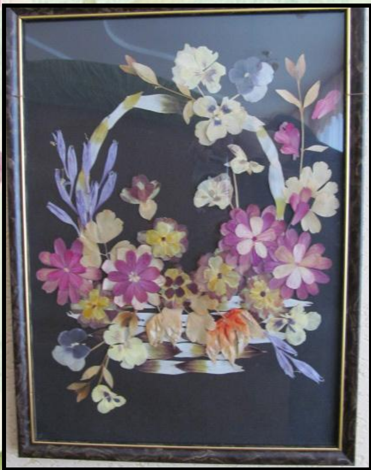
Ешибана “Весняні барви ”