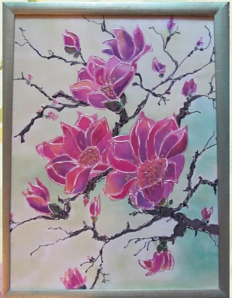
Розпис батіком по тканині ” Квітуча сакура ”