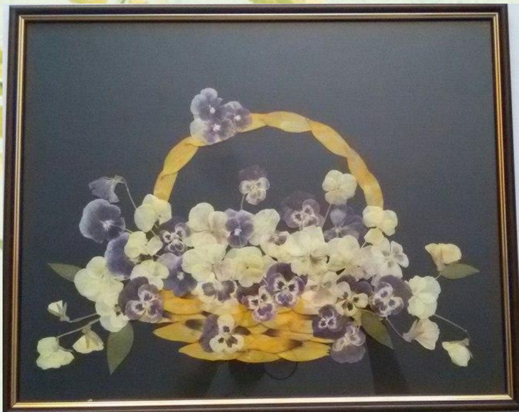
Ешибана “Кошик з квітами ”