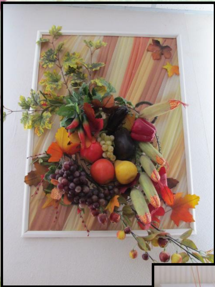
Панно ”Золота осінь ”