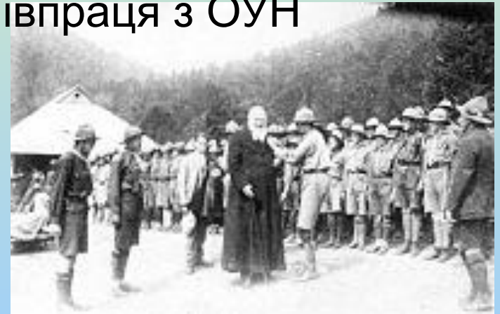
Андрей Шептицький на Соколі