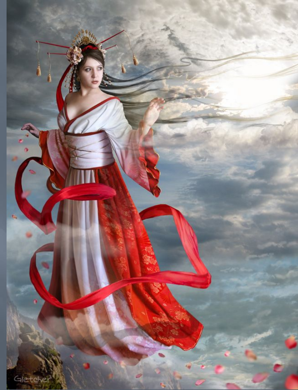
Аматэрасу Омиками, богиня Солнца

Основа синто состоит в обожествлении природных сил и явлений и поклонении им. Считается, что у многих вещей есть своя духовная сущность — ками. Ками может существовать на Земле в материальном объекте, причём не обязательно в таком, который принято считать живым в стандартном понимании, например в дереве, камне, священном месте или явлении природы, и при определённых условиях может оказаться в божественном достоинстве. Некоторые ками являются духами местности или определённых природных объектов (например, дух конкретной горы), другие олицетворяют глобальные природные явления, такие, как Аматэрасу Омиками, богиня Солнца. Почитаются ками — покровители семей и родов, а также духи умерших предков, которые считаются покровителями и защитниками своих потомков. Синто включает магию, тотемизм, веру в действенность различных талисманов и амулетов. Считается возможным защита от враждебных ками или подчинение их при помощи специальных ритуалов.