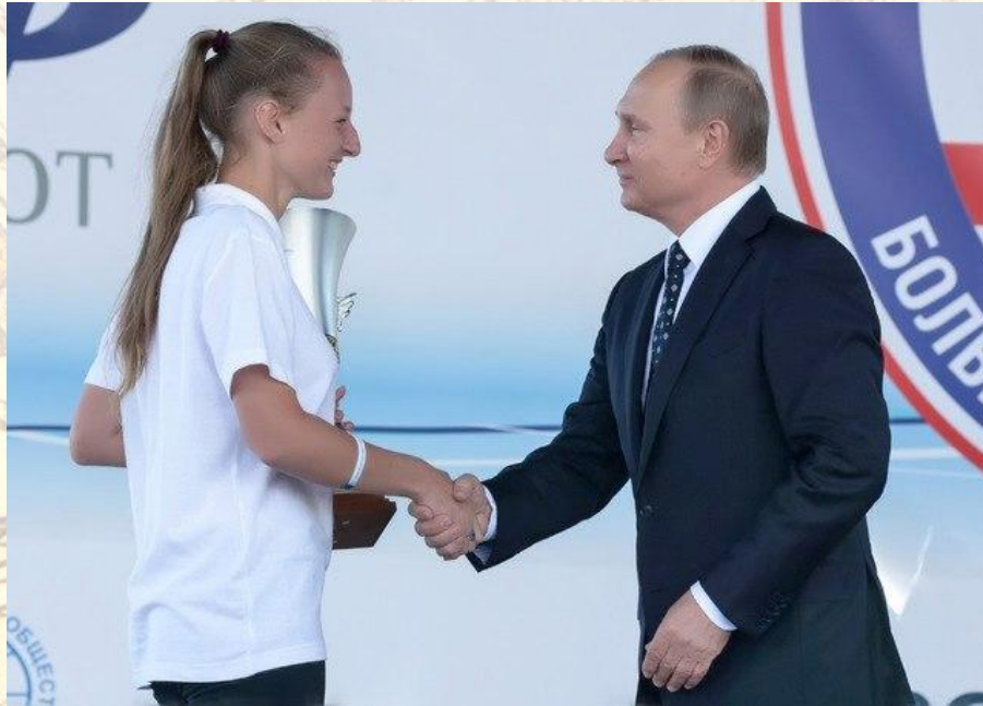
Председатель Попечительского Совета РГО В.В. Путин награждает волонтера, участника молодёжных проектов Русского географического общества А.А.Никифорову