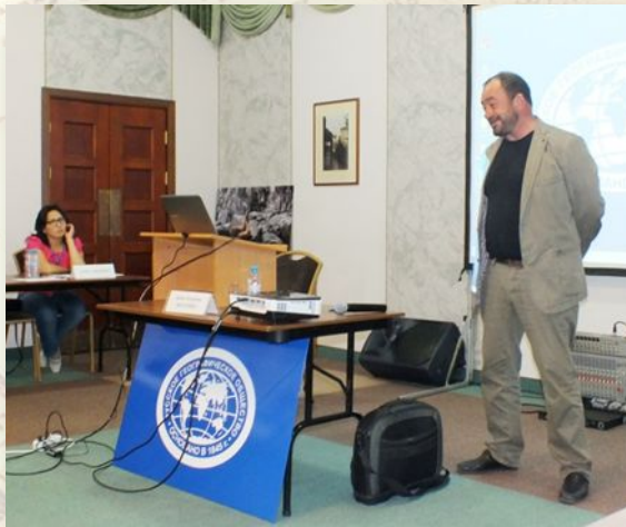
Журналист, телеведущий М.Ю. КОЖУХОВ