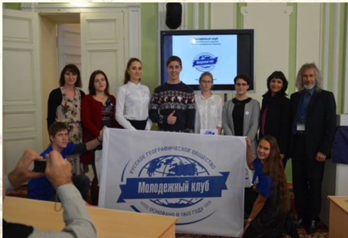
Торжественное открытие клуба