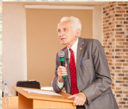
Почетный Президент Общества, академик РАН В.М.КОТЛЯКОВ

Лучшие ученые-теоретики и практики в области физической, экономической, социальной географии, психологи, методисты, представители государственных структур и учреждений, путешественники, известные личности. В разные годы перед участниками летней школы выступили ведущие ученые из России, США, Дании, Франции, Австрии, Израиля и Нидерландов