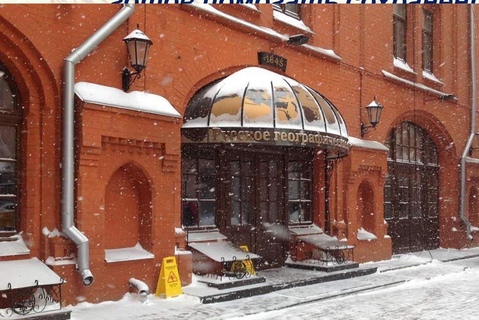
Штаб – квартира в Москве

а также энтузиастов-путешественников, экологов, общественных деятели и всех, кто стремится узнавать новое о России, кто готов помочь сохранению её природных богатств