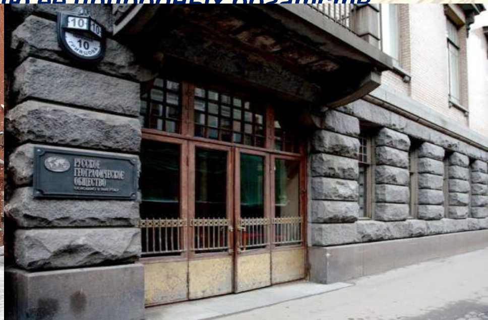
Штаб – квартира в Санкт -