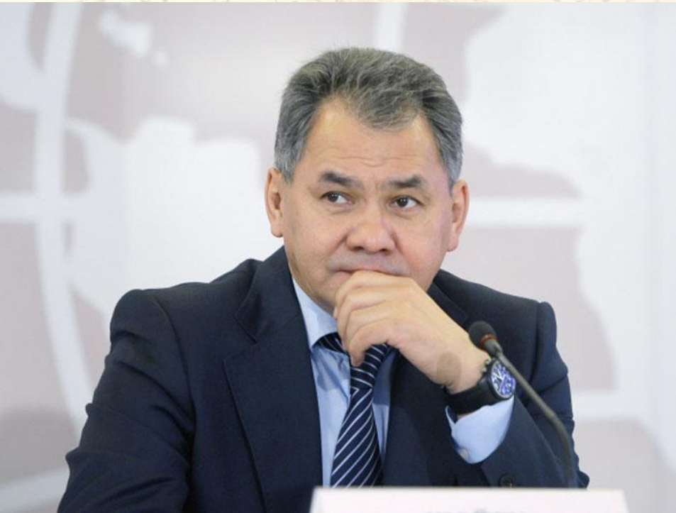
Шойгу Сергей Кужугетович Президент РГО (с ноября 2009 г.)

«Наша задача – помочь людям заново открыть Россию»