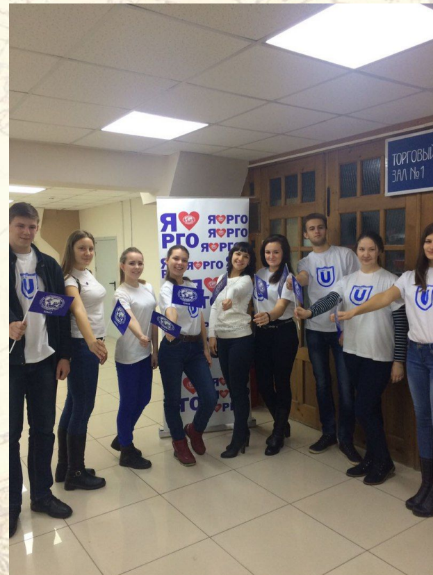
Первая волонтерская работа Всероссийский географический диктант