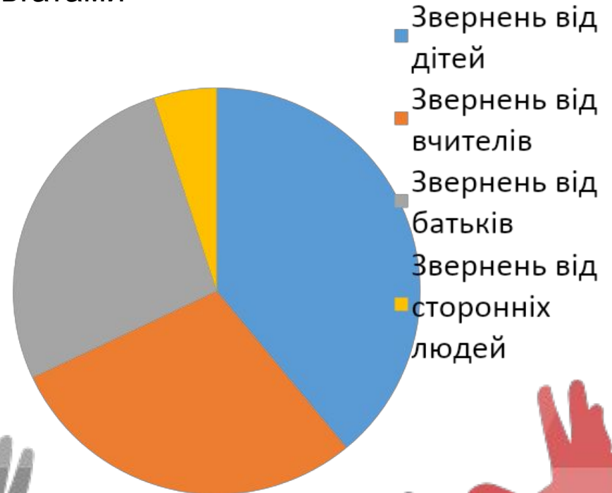
Статистика звернень про булінг

44% школярів (спостерігачів) ігнорували булінг через страх.