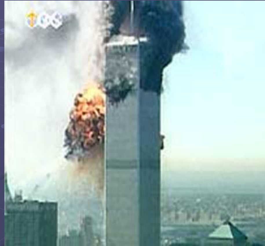
Крупномасштабные акции против мирового сообщества