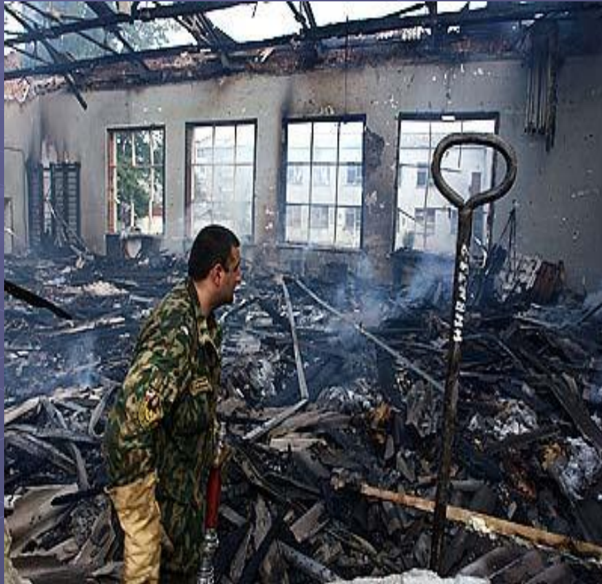
Массовая гибель людей