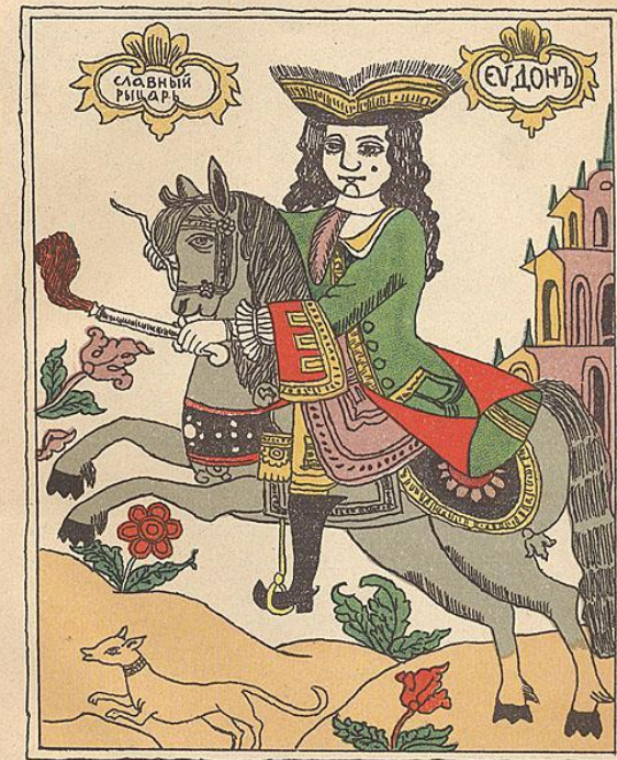
Славный рыцарь Евдонъ. (Копия народной картинки.)