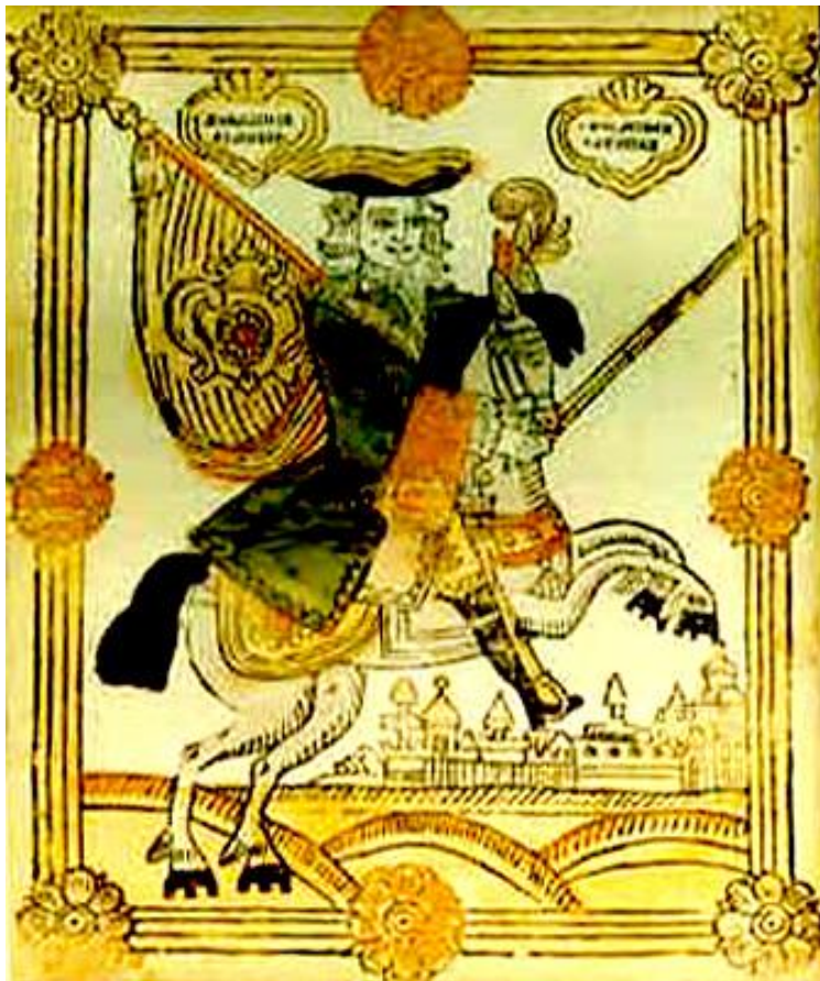
Храбрый рыцарь Венциан Францел (лубочная картинка)