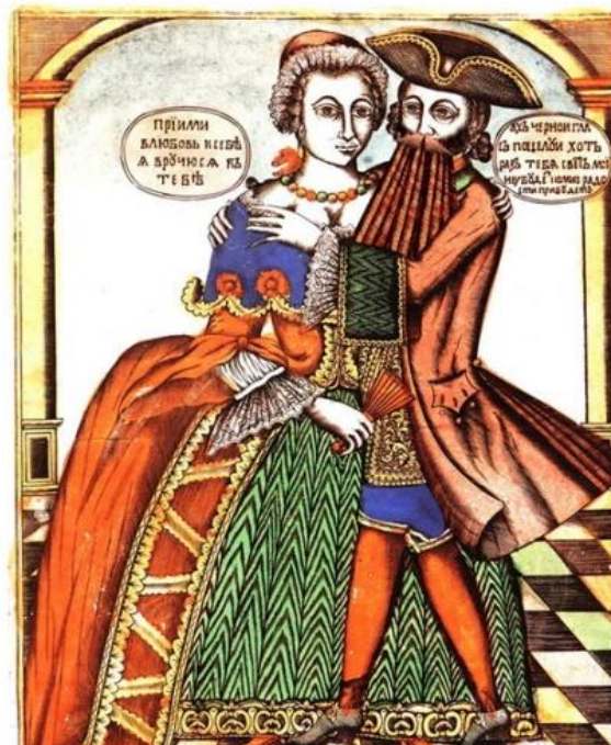
Кавалер с дамой (лубочная картинка)