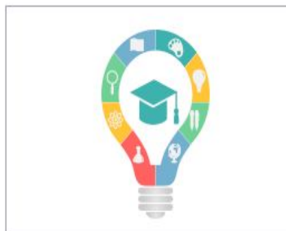
Международные олимпиады по общеобразовательным предметам