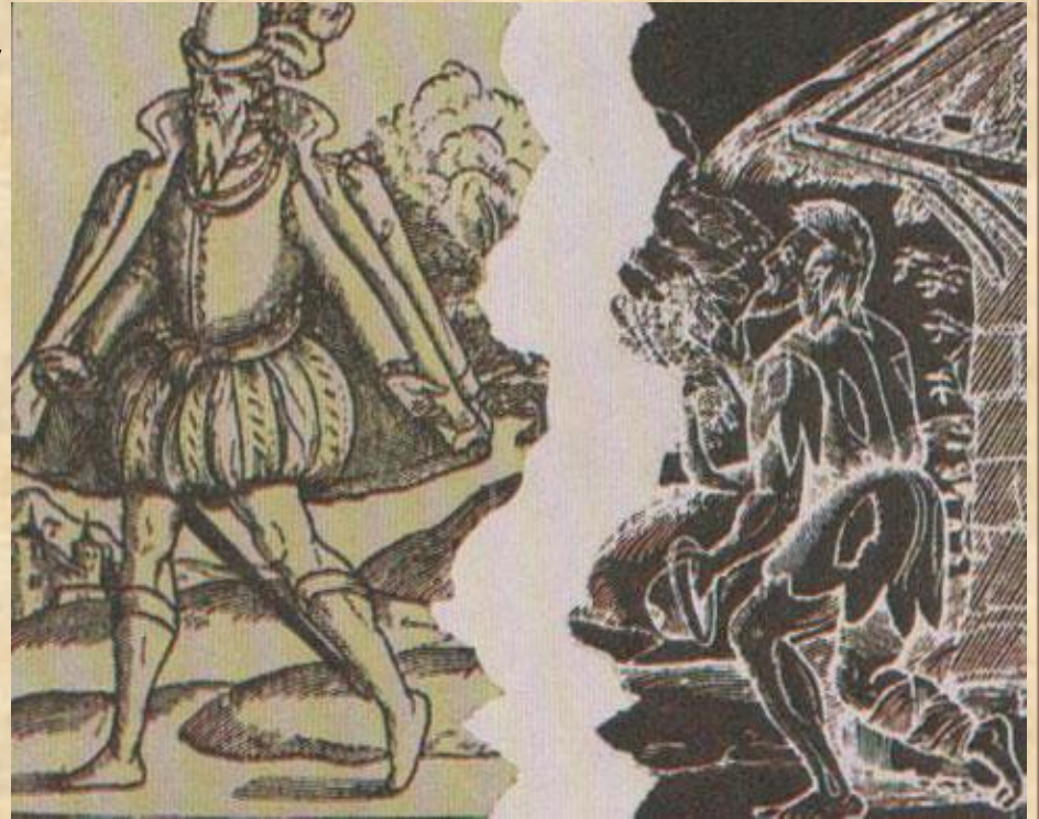
Богатый модник и бродяга – оборванец (гравюра конца XVI века)