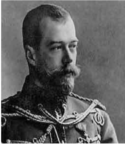
Николай II (1894-1917 гг.)